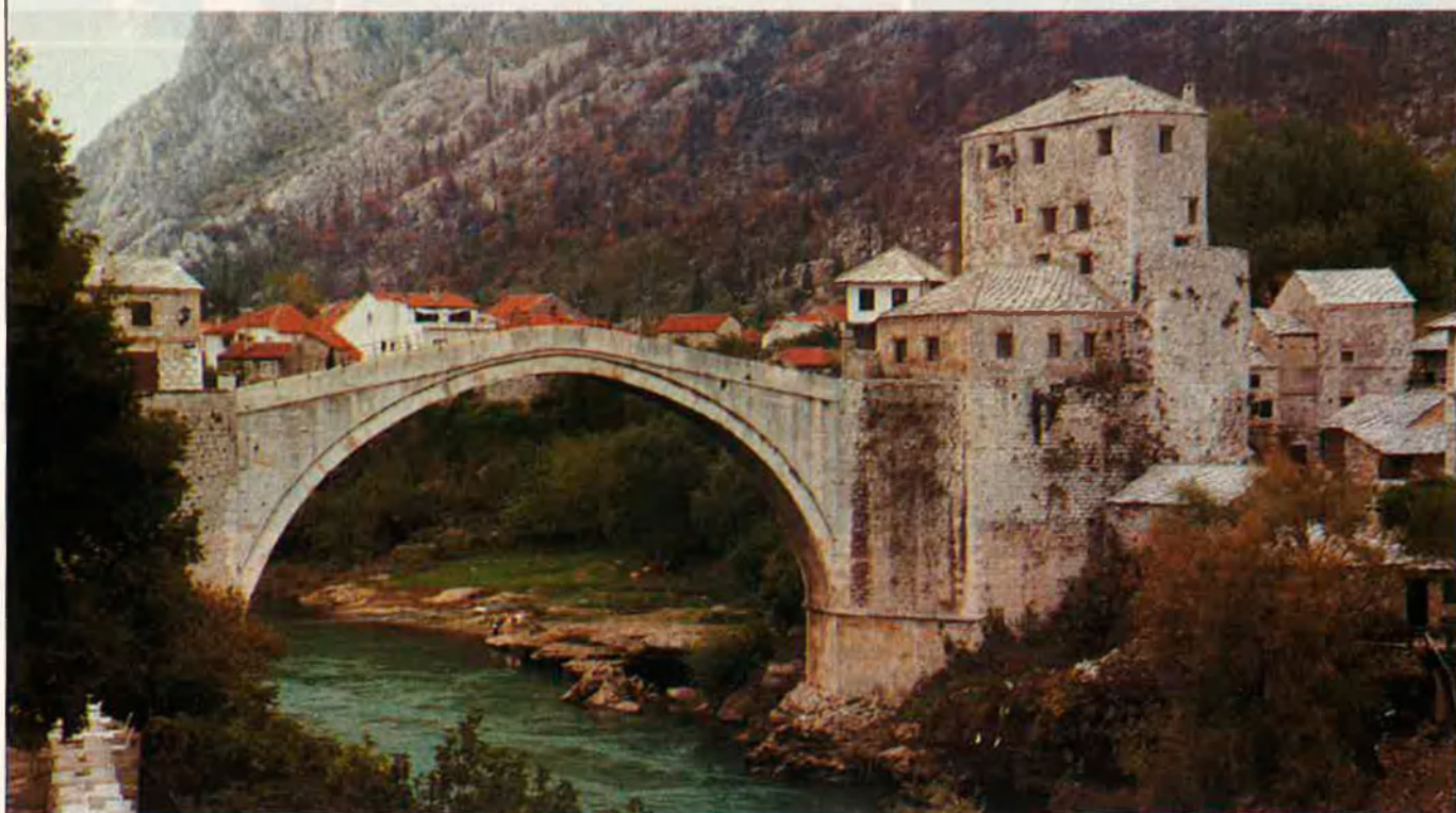
El típic pont turc de la ciutat de Mostar, a Bòsnia-Herzegovina.

Problemes nacionals i ètnics, crisi econòmica i transició a la democràcia marquen el complicat moment actual de Iugoslàvia, que podria fins i tot acabar amb la federació.