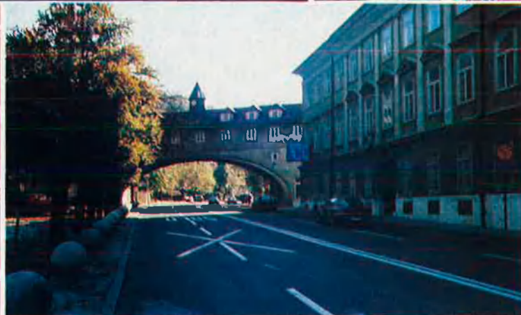
Franjo Tuđman. Eslovens i croates mostren el seu nacionalisme a les plaques de matrícula. Ljubljana té l'encant de les ciutats centroeuropees. I bitllets iugoslau

no hi ha ni televisió ni ràdio federal i que el Parlament de Belgrad poca cosa té a fer, conclourem que Iugoslàvia es desfà. Només cal esperar per saber la manera com això es produeix i el resultat que en surt.