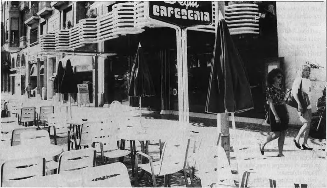
Cafeteria Dellfin, tertúlia habitual de molts pied-noirs, i centre lepenista d'Alacant.

25.000 francesos. Un cementiri que des de 1954 a 1962 va centrar l'atenció del món, i que llançà al sud valencià uns 40.000 colons. El 75 per cent d'ells a Alacant. Le Pen compta en aquella ciutat i a les comarques veïnes amb una gruixuda guita de fervorosos admiradors entre la gran família pied-noir. Però els pied-noirs ja no figuren com aquell gran fenomen col·lectiu, unit i bel·licós dels anys seixanta. Molts volen oblidar, i faccions i baralles han disseminat la colònia. No tots els pied-noirs, a més, comulguen amb la dreta dura. Molts admiren els socialistes Felipe González o François Mitterrand.