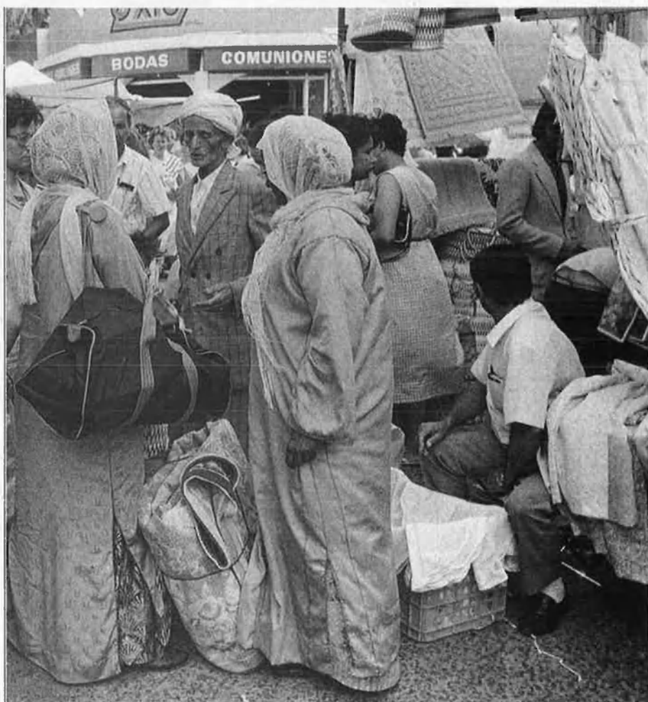
Els veterans ex-OAS conspiren per expulsar els àrabs d'Alacant, i tornar a Algèria.