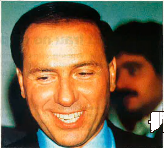
Silvio Berlusconi, president de l'A.C. Milà i propietari del Canale-5. Josep Lluís Núñez, més d'una dècada al front del Barça.

creu que no té per què ser diferenciat, ja que, segons ell, "el govern ha deixat molt clar, amb la nova Llei del l'Esport, que considera les societats esportives com unes societats anònimes més", i per tant pareix que hi haurà un tracte de favor per a l'esport tal i com ocorre a Itàlia.