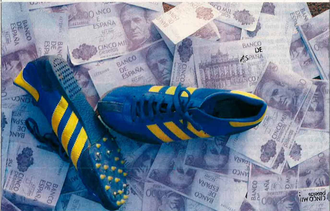
Un negoci que mou molts milions.

Però no sempre és tot favorable a la inversió en aquesta matèria, perquè, entre altres coses, el tractament fiscal que es dona a la inversió en esports i l'estructura jurídica dels clubs influeixen de manera decisiva en la rendibilitat i seguretat de la