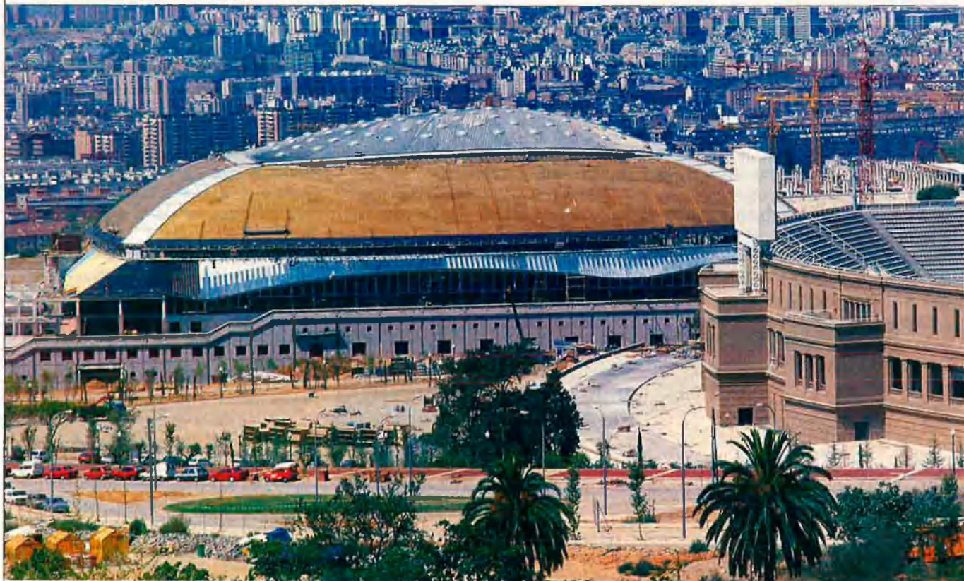
Vista de l'estadi de Montjuïc.

La proximitat de les eleccions municipals fa pensar que podria renàixer la dialèctica político-urbanística que va tenir el seu moment culminant la primavera del 83, quan el delegat d'Urbanisme d'aleshores de l'Ajuntament, Oriol Bohigas, polemitzà obertament sobre el model de ciutat a aplicar amb Ricard Bofill, que assessorava en aquests afers el candidat de CiU, el malaurat Ramon Trias.