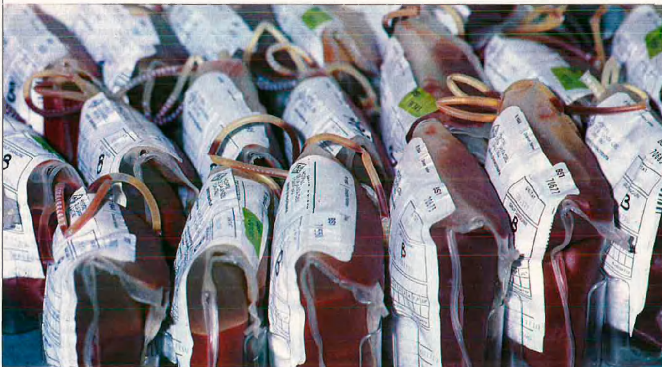
La creació del Centre Regional de Transfusions de la Generalitat valenciana ha estat un element clau per eliminar els risc dels bancs privats.