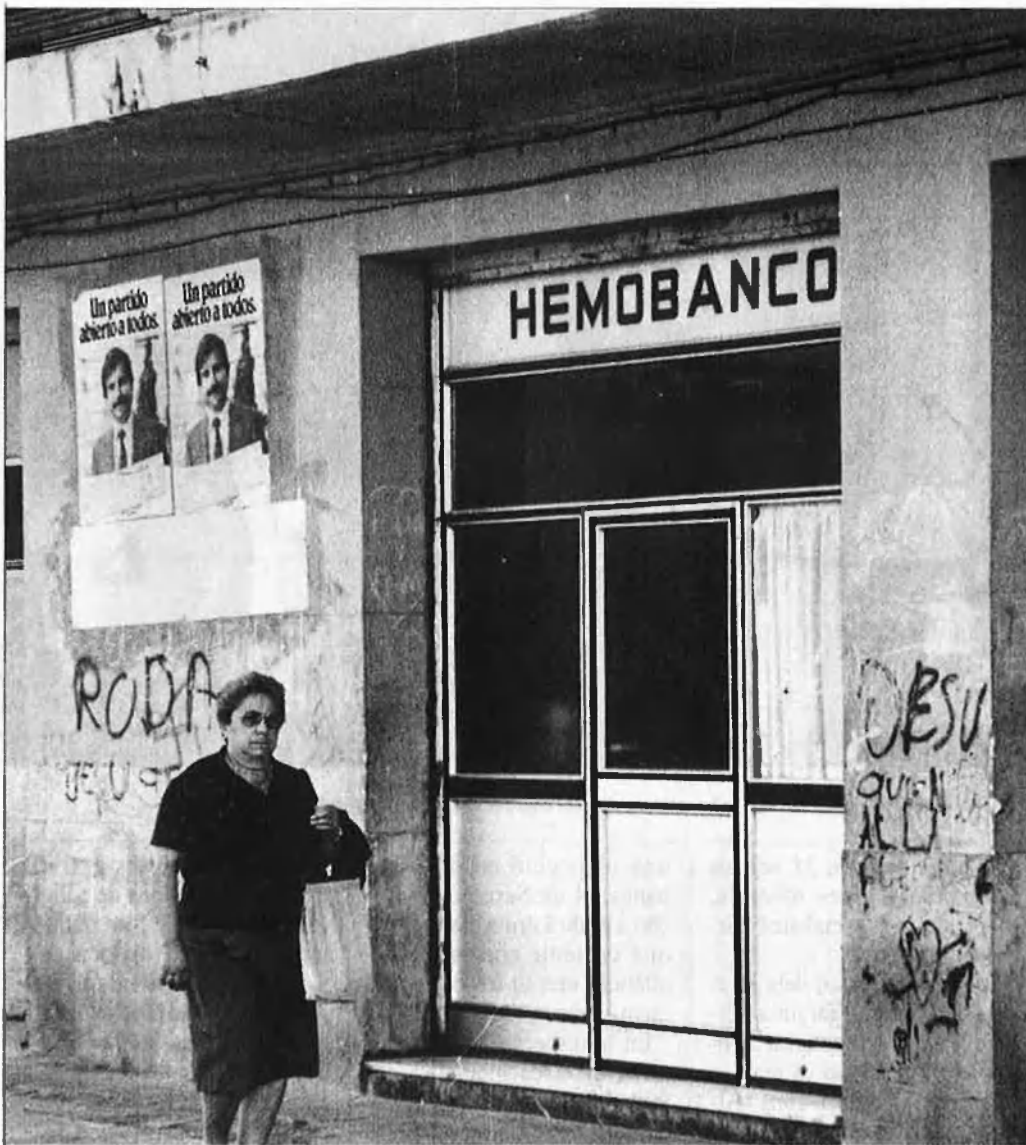
Els locals, ja tancats, no seleccionaven els seus proveïdors.

molts estaven borratxos i alguna vegada vam veure algú drogar-se amb una xeringa. Un dia aparegué un home mort a la porta del local".