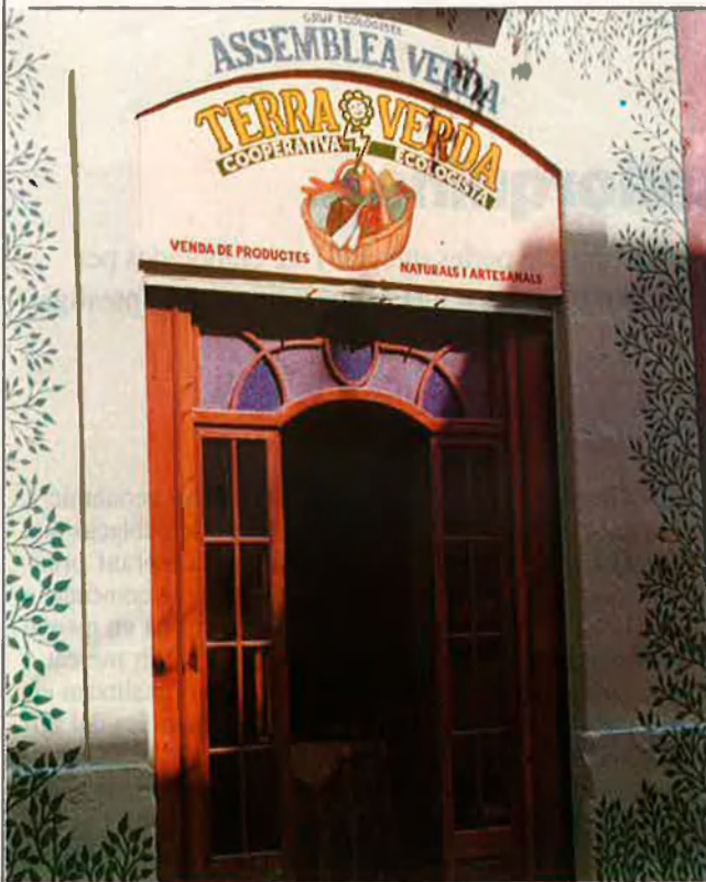
Cooperativa ecologista Terra Verda.

les campanyes o activitats, tampoc és un fidel reflex de la capacitat d'actuació dels diferents grups. Moltes vegades omplen veritables buits de l'administració pública en alguns camps i, fins i tot, enceten recerques originals que no arriben més lluny per falta d'ajudes monetàries.