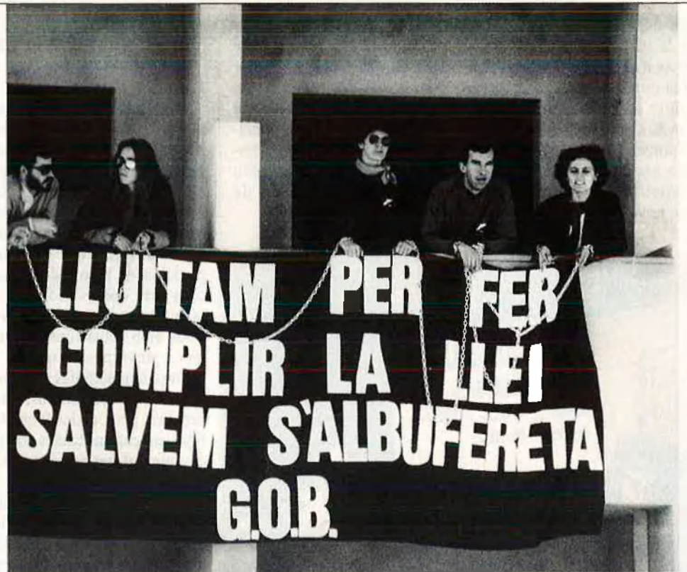
Acció del Grup Balear d'Ornitologia i Defensa de la Natura (G.O.B.)

De tota manera, si ajuntem el manteniment dels locals, sous (si n'hi ha), l'edició d'un butlletí intern i totes les fei-