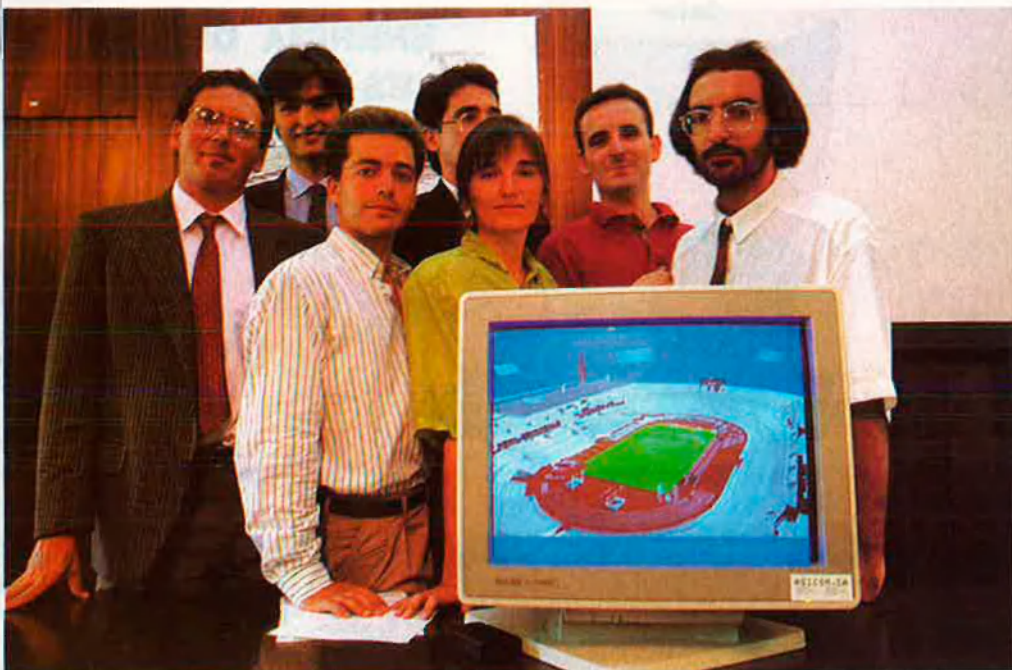
La Universitat Politècnica de Catalunya posa l'ordinador al servei de la televisió olímpica.

ció de les càmeres de televisió a l'Estadi Olímpic de Montjuïc és una de les operacions que poden dur més temps, segons els mitjans que s'utilitzin. Sortosament, la informàtica ha vingut a jutjar del COOB. Si l'elaboració dels horaris de totes les competicions ja s'ha fet amb suport informàtic, perquè si no la complexitat del treball obligaria a molts mesos d'adaptació, un grup d'alumnes de la Universitat Politècnica de Catalunya –UPC– ha elaborat un projecte que posa l'ordinador també al servei de la televisió olímpica. Es tracta d'un treball pràctic realitzat en el marc de l'assignatura de projectes per part de sis alumnes de l'Escola Tècnica Superior d'Enginyers Industrials de la UPC. El grup està