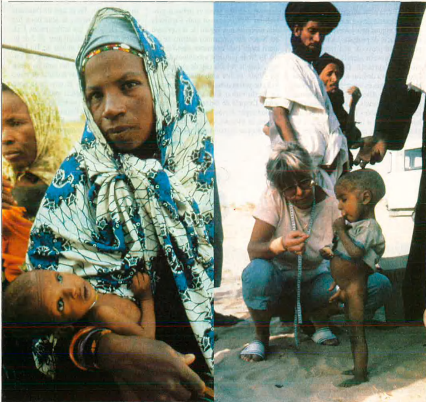
La sequera, la fam, el nomadisme... I ara, la repressió.

braços de sa mare morta. Quan no hi havia res que es moguéss al campament, han baixat dels vehicles i han amuntegat els cossos, els han amarat amb gasolina i hi han calat foc. Dos dies més tard, els cadàvers de cinc xiquets i una dona han estat trobats, més lluny a la vall, en l'aigua d'un petit toll. No eren identificables".