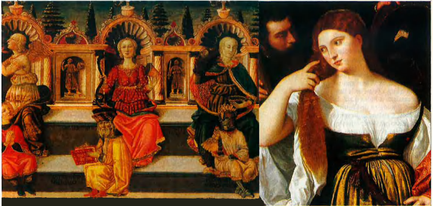
Noia davant l'espill, de Tiziano.

conservat i conserven els seu hereus. Un altra, Crist beneït entre dos àngels , atribuïda a Fiorenzo di Lorenzo, o a l'Escola de Perugino, que Cambó va regalar als pares Caputxins de Sarrià. Finalment, i mort Cambó, en retirar els quadres dipositats al museu de Lausana, es va deixar una de les