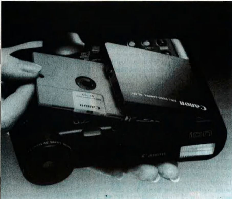
Canon Ion, que substitueix la pel·lícula per un disquet.

reproductor, fabricat en col.laboració amb la Philips i els americans de Sun i que costarà unes 50.000 pessetes. El disc compacte per a 24 imatges costarà unes 2.000 pessetes i també hi haurà un