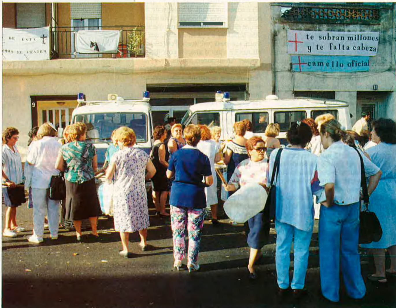
Les reaccions contra la instal·lació de centres per a marginats tenen de vegades uns motius molt foscos.

L'afer de Patraix, especialment virulent, no és més que un exemple dins una llarga llista d'episodis amb un element