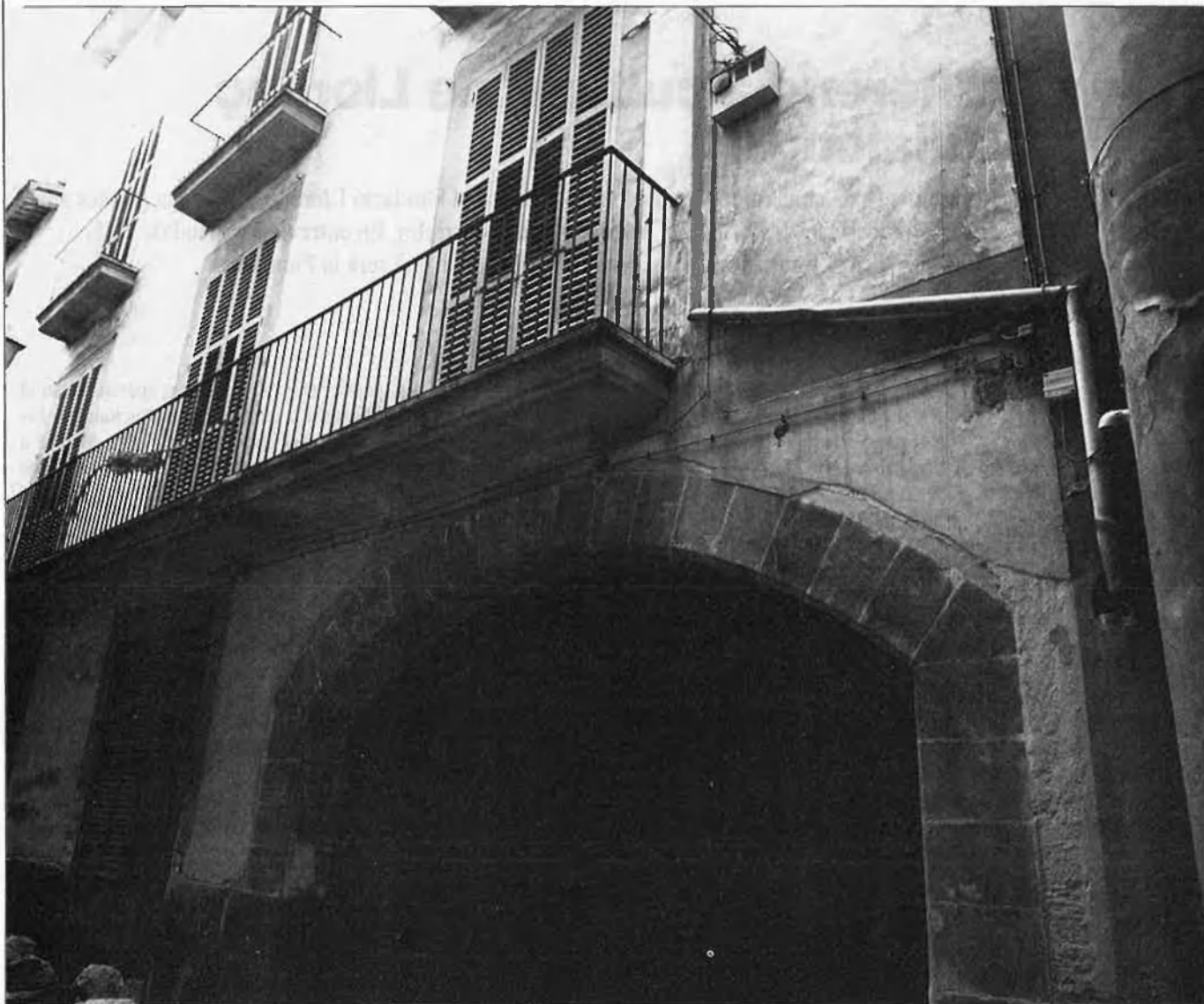
Casa de llorenç Villalonga a Palma.