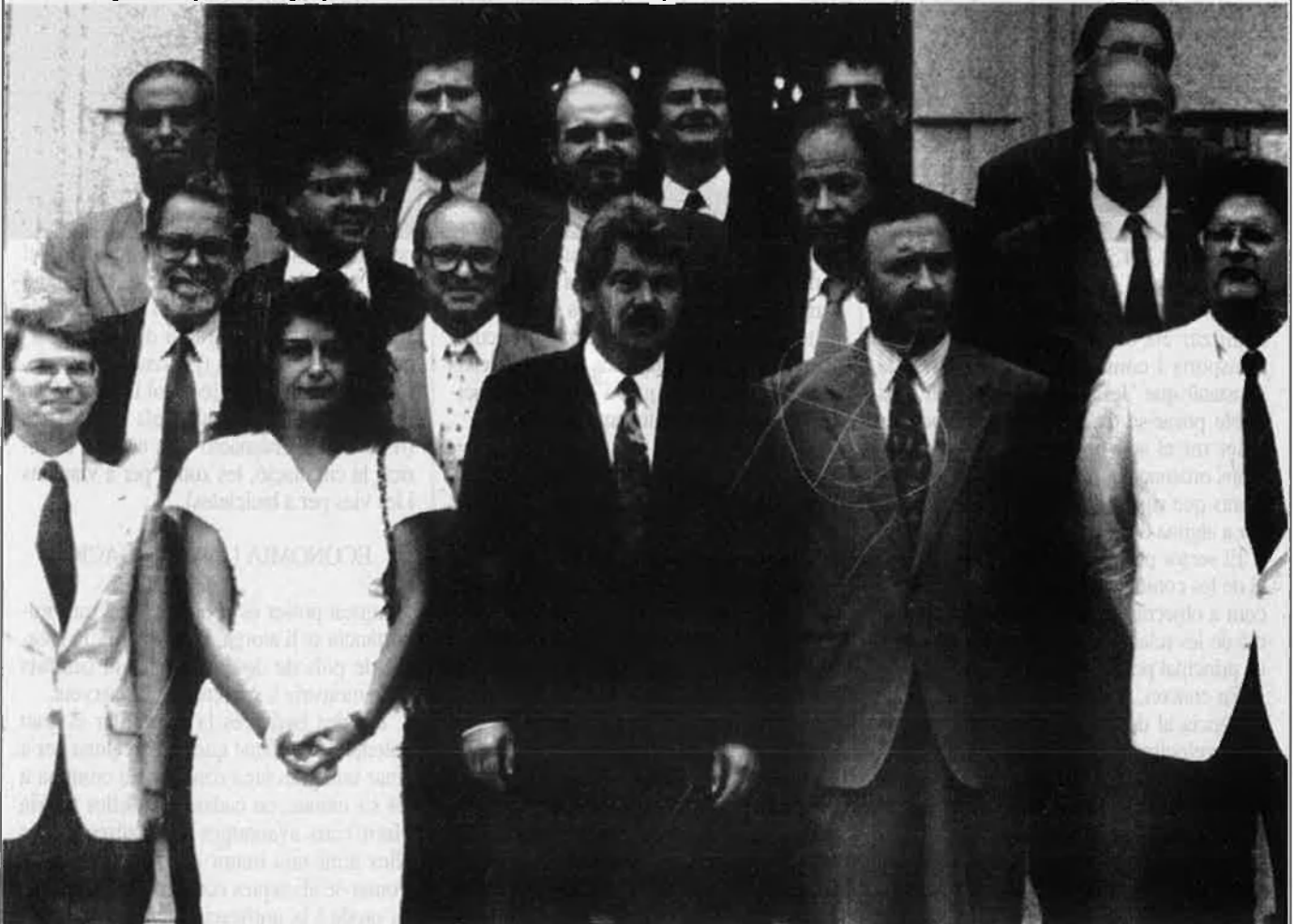
Els alcaldes, abans de la reunió.

vembre, sorgí el Manifest signat pels alcaldes on s'expressa el desig de col.laboració entre les ciutats, com també un document on s'exposen els eixos principals en què es basarà la futura cooperació. Una cooperació que té com a objectiu final la definció d'aquesta zona geogràfica com a poder prou fort per afrontar els reptes futurs. Una zona que, en paraules de Francesc Raventós, segon tinent d'alcalde de Barcelona, "a vegades no sabem si som el sud del nord o el nord del sud".