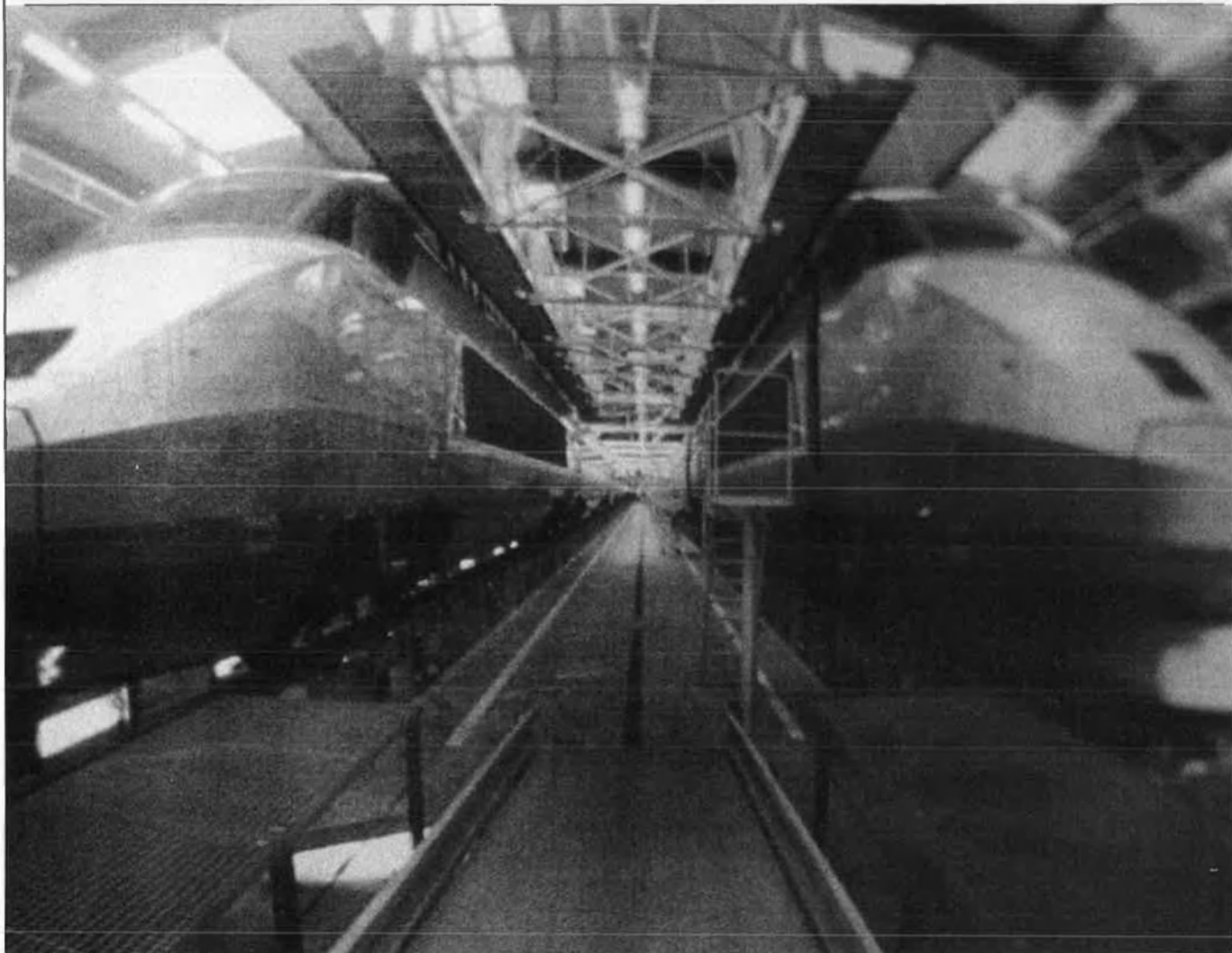
El TGV, la prioritat mediterrània.

ció entre ambdues iniciatives: "no pens que això sigui una iniciativa substitutòria. Jo pens que és molt difícil fer una Eruopa de les regions. L'Europa dels Estats ja hi és i la unió europea es realitza més a través de les ciutats que a través de les regions. Les ciutats són els elements dinamitzadors de les regions, els contactes entre regions són més vaporosos des del punt de vista de la realitat dels intercanvis. Les regions i les nacionalitats només han dut guerres a Europa; en canvi, les ciutats han estat més progressistes en la configuració de l'Europa moderna, i pensem que ho continuaran sent".