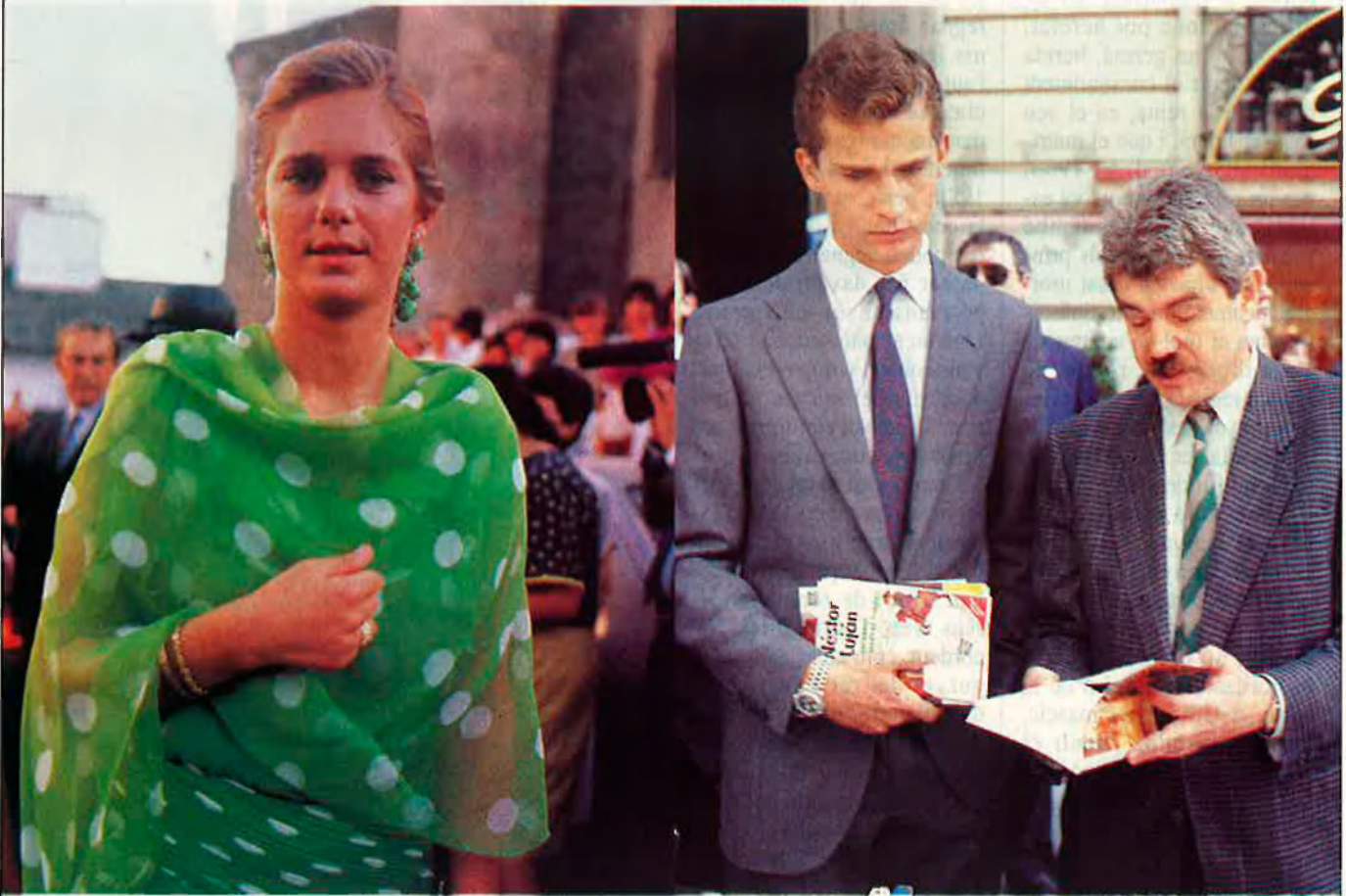
La Pragmàtica de Matrimonis, vigent des de Carles III, prohibeix el matrimoni desigual.

Segons l'estudi fet per a EL TEMPS per Armand de Fluvià, president de la Societat Catalana de Genealogia, Heràldica i Sigil·lografia, si el príncep Felip de Borbó contraiguera matrimoni amb Isabel Sartorius hauria de renunciar al tron.