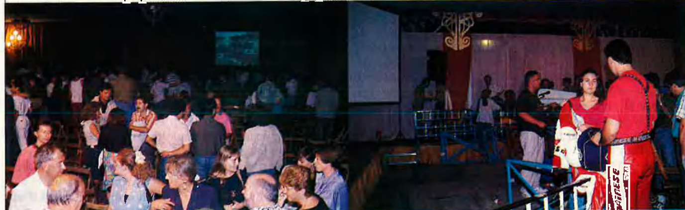
Pantalla gegant i gegant decepció. L'envelat, al fons: la festa s'havia acabat.