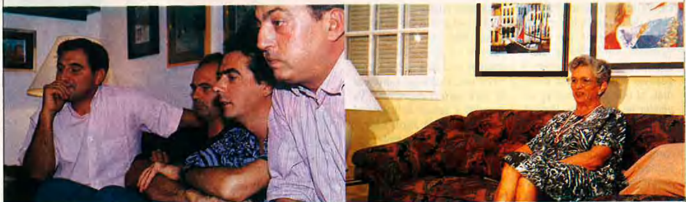
L'emoció es transcriu als rostres. La mare de Cardús no ho va voler veure.