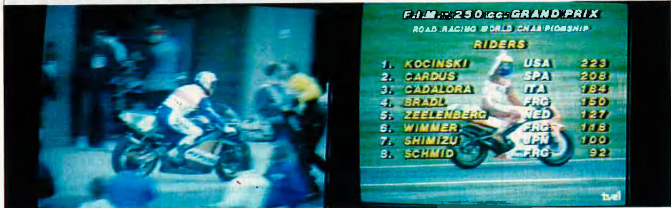
Carles Cardús abandona per problemes. Kocinski i la classificació superposada.