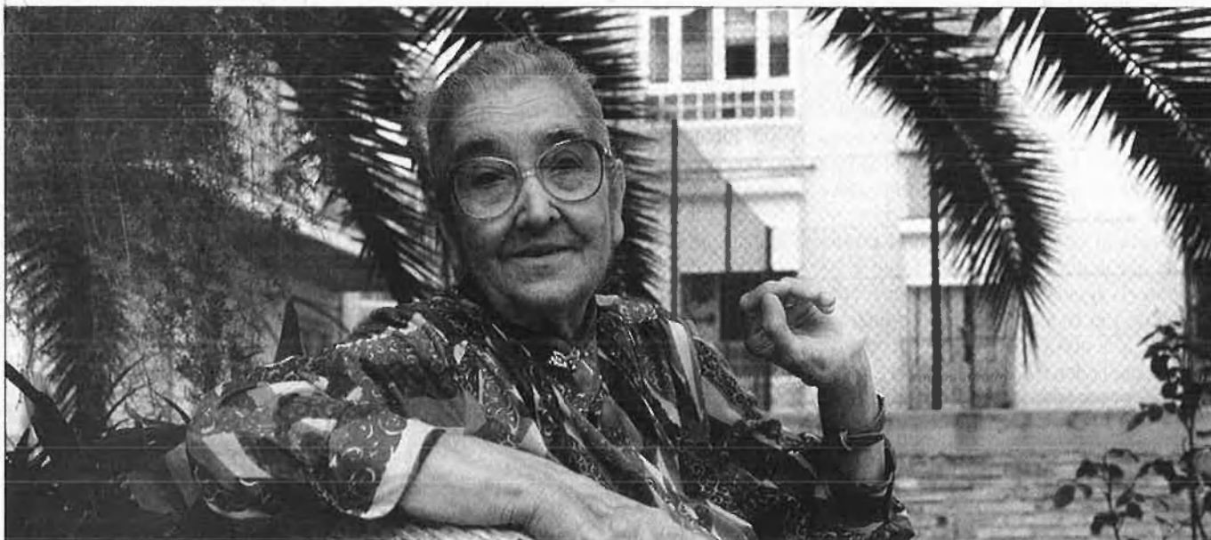
"Jo sempre he anat a l'escola pública".