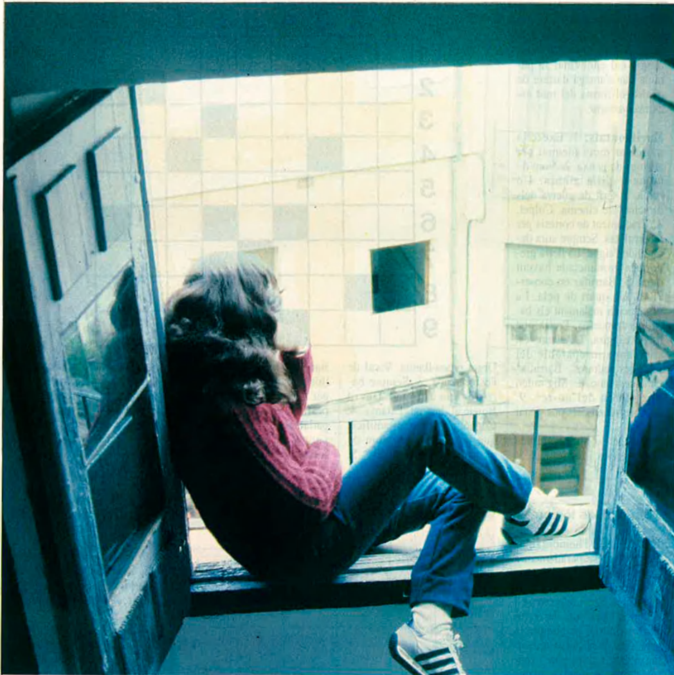
Quedar-se a viure amb els pares, una opció cada vegada més habitual.

esquizofrènica. És un pal haver d'aixecar-me i vestir-me a mitjanit per anar corrents a casa i tornar-me a ficar al llit...".