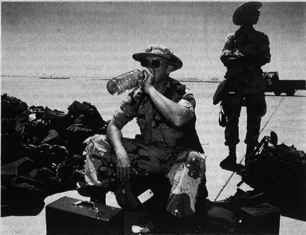
Charlie no feia surf i Saddam no juga al golf

seva part i està organitzant la commemoració del 380 aniversari de l'expulsió dels moriscos amb la col·laboració del Grup de Recerca Arrels. El fet no és casual: gran part dels expulsats van abandonar el país pel port dels Alfacs. Del 15 de juny al 16 de setembre de 1610 van passar per aquest port més de 41.000 moriscos procedents de Catalunya i Aragó, l'embarcament més nombrós de tot l'Estat. Altres ports que van servir per a l'embarcament dels moriscos van ser Vinaròs i Monçofar, València, Dénia i Alacant,