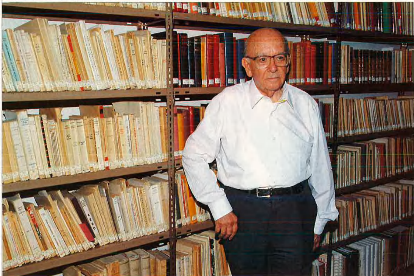
"Potser hi ha molts més jesuïtes fora de la Companyia que dins".