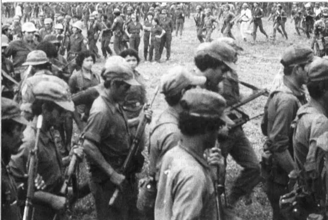
A l'esquerra, retirada de les tropes soviètiques d'Afganistan. A la dreta, contingent de tropes nicaragüenques.

Tanmateix, la seua oferta a les comunitats autònomes de diverses tribus afganes no ha obtingut el suport dels guerrillers Mujahedin que compten amb el suport americà. Els experts europeus veuen en Kabul l'estat satèl·lit que està més d'acord amb Moscou.