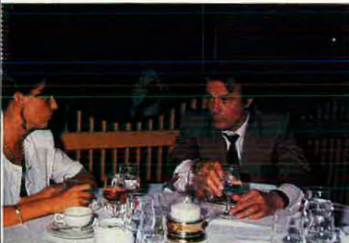
Alain Delon sopant a l'Up and Down: va seduir a tothom.

tot va somriure a tothom, i això és un gran que.