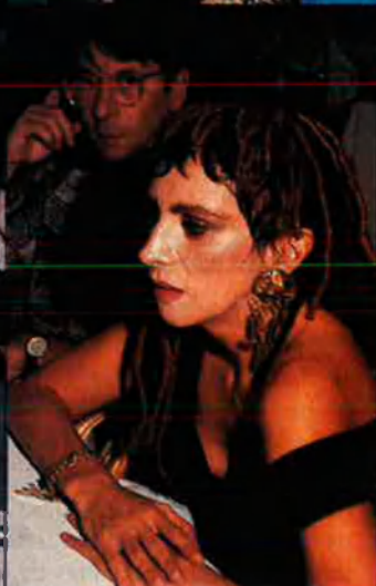
Nacha Guevara, una iaia d'allò més bonic.

de top model , rossa amb molta gomina als cabells, però continua mantenint els seus encants als 52 anys confessats i ser àvia de dues nenes. Com que és una dona realista, confessa que s'ho ha operat tot i de tot arreu. Fins i tot les dents, diu, són postisses. Tanta sinceritat fa fàstic, però el resultat és excel·lent. Duia un escot prominent i es feia mirar més que qualsevol noieta de 18 anys. Però hi ha-