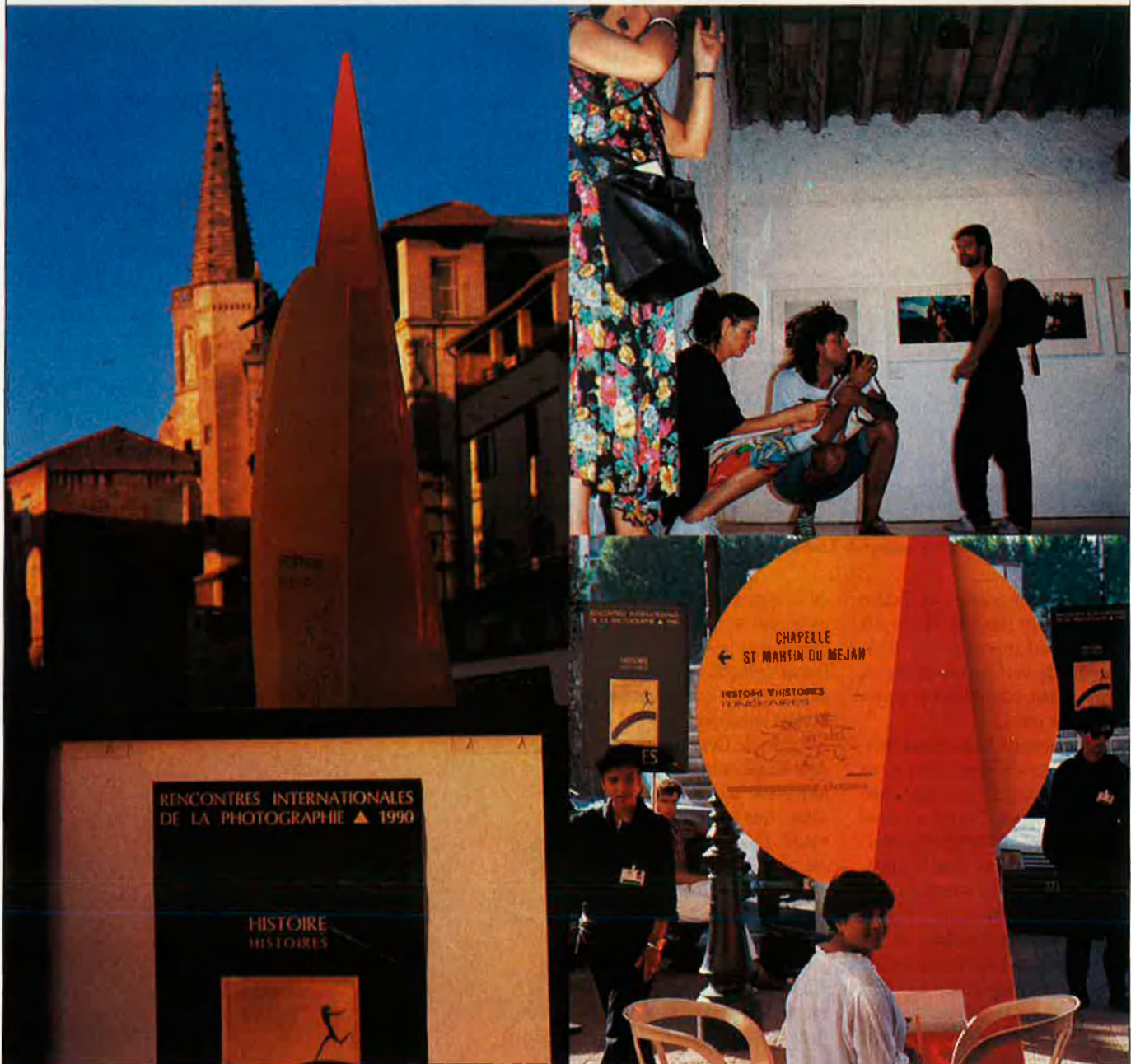
Milers de visitants acudeixen cada any a Arle.

fotos roden pels cenacles i són comentats pels professionals més competents. Arle és un gran espectacle fotogràfic d'estiu, amb els seus àudio-visuals nocturns en un marc