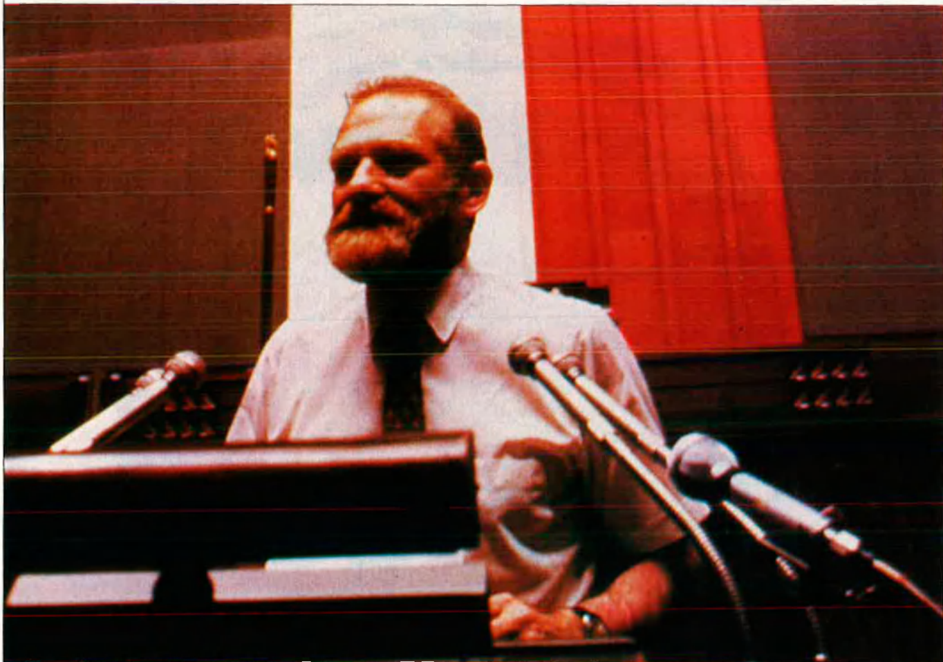
"El que més temo és que es trenqui la línia de confiança entre la societat polonesa i les elits polítiques".

mariscal Pilsudski, que el 1926 va atemptar contra el govern elegit?