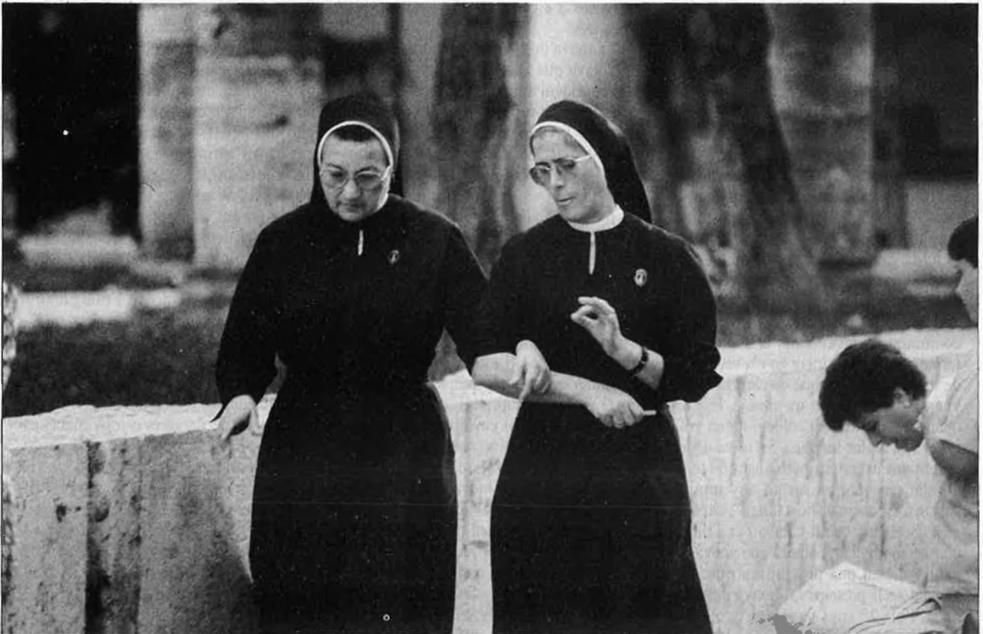
→ La crida de Déu torna a atraure el jovent.