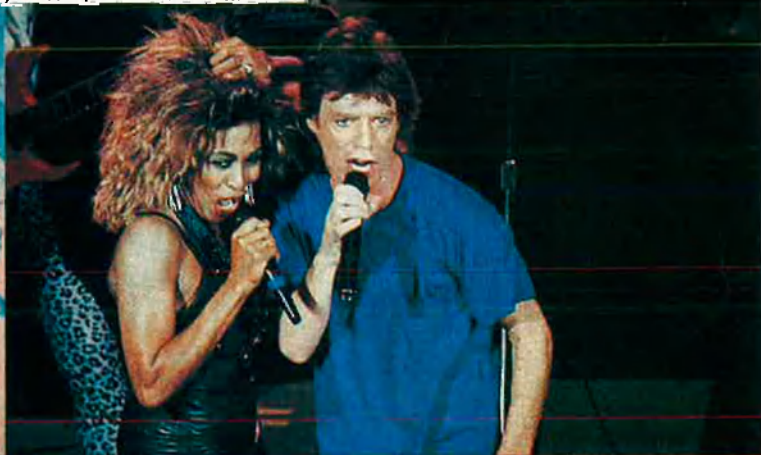
Pete Townshend, Joe Cocker, Tina Turner i Mick Jagger i Lou Reed.

força que radica en aquest lirisme modern que l'han acostat a tota mena de públic.