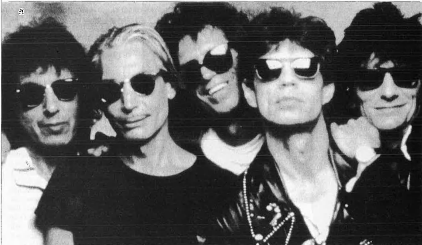
The Rolling Stones.