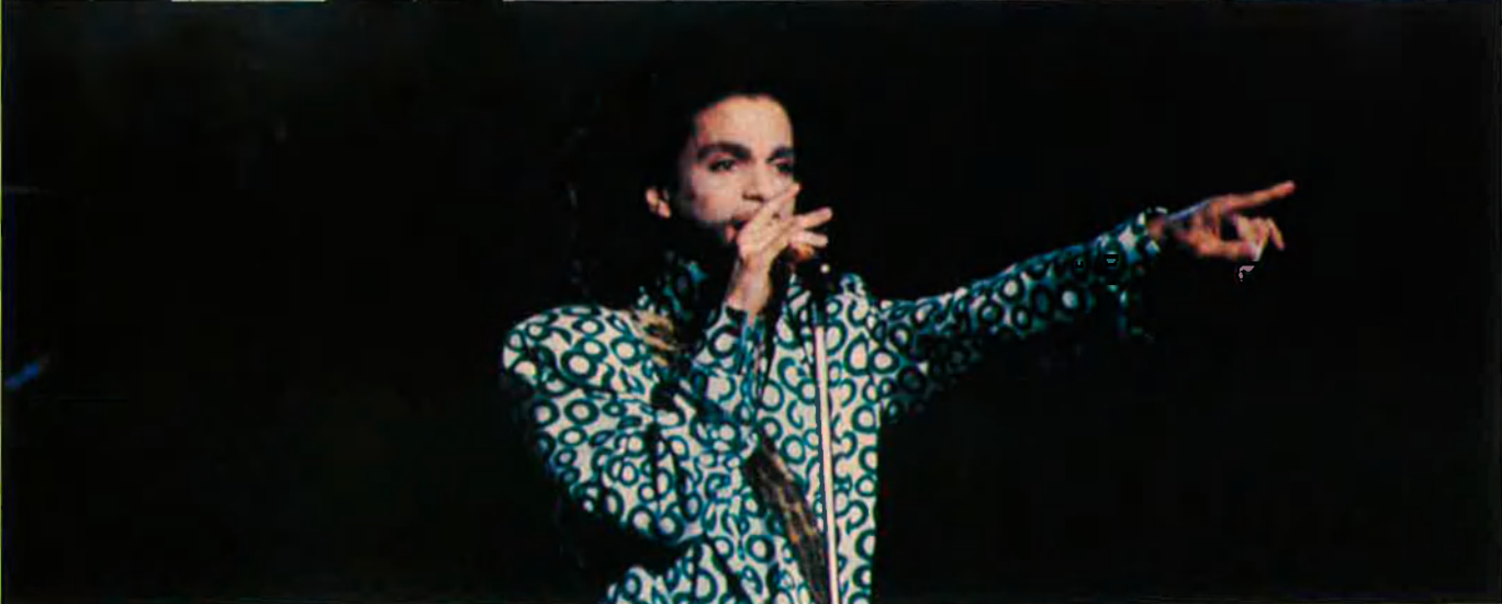
Madonna, Jackson i Prince.

Citem l'italià Franco Battiato per constatar l'existència d'una música i una poètica mediterrània, no anglosaxona, dins l'ampli espectre del rock internacional. Battiato és un cantant a mig camí entre el surrealisme i la tradició mediterrània (eu-