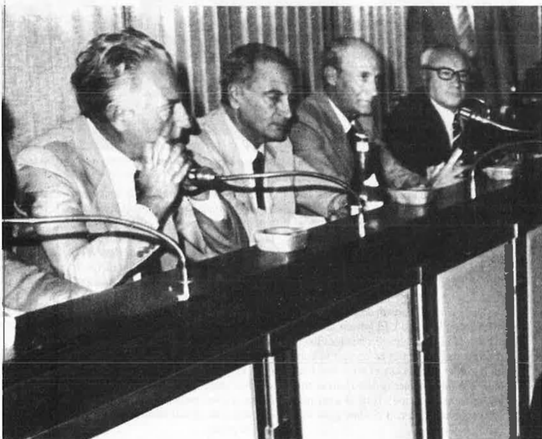
Francesco Cossiga testificant en el judici seguit contra les Brigades Roges per la mort d'Aldo Moro.

Com que l'entrevista es donà enmig dels Mundials de Futbol, no va obtenir gaire ressò. El president italià, Francesco Cossiga, tres dies després demanava per carta al primer ministre, Giulio Andreotti, i al seu govern que investigués l'afer per treure'n l'entrellat. Tampoc aleshores el fet va colpir l'opinió pública fins que el dia 21 de juliol la premsa publicava la carta de Cossiga a Andreotti i la gent hi prenia interès. A partir d'aquell moment sortiren a la llum noves dades i un munt d'interrogants i suposicions de tota mena. L'afer, a més d'afectar Itàlia i els Es-