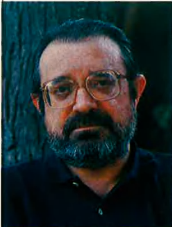
Jaume Perich, humorista:

Poca gent fa plans dos anys abans, però una vintena de personatges protagonistes de la vida social i cultural catalana han acceptat respondre a la pregunta formulada per EL TEMPS: "¿Què t'agradaria fer el 25 de juliol del 1992?"