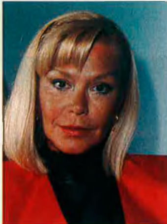
Teresa Gimpera, actriu:

"El més probable és que no engegui el televisor en tot el dia. I no estaré a l'estadi olímpic, això ho sé amb molta anticipació. Barcelona és cada dia més espantosa. Però aquell dia a més d'espantosa hi haurà un nivell d'estupidesa superior al normal. No penso ni contestar el telèfon, no fos cas que se'm posés algun atleta..."