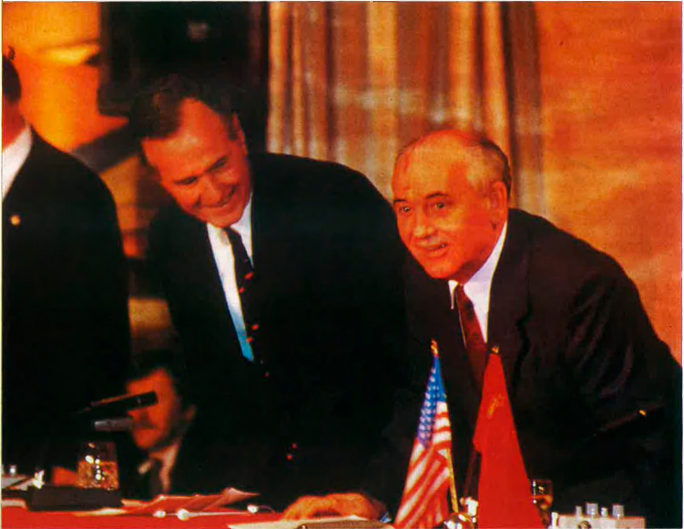
Mikhaïl Gorbatxov amb el seu rival George Bush.

vista pel poble soviètic com una prova d'opressió i corrupció. En els actuals sondejos d'opinió el sentiment més amarg de la gent està reservat als que s'han enriquit amb la política econòmica de Gorbatxov.