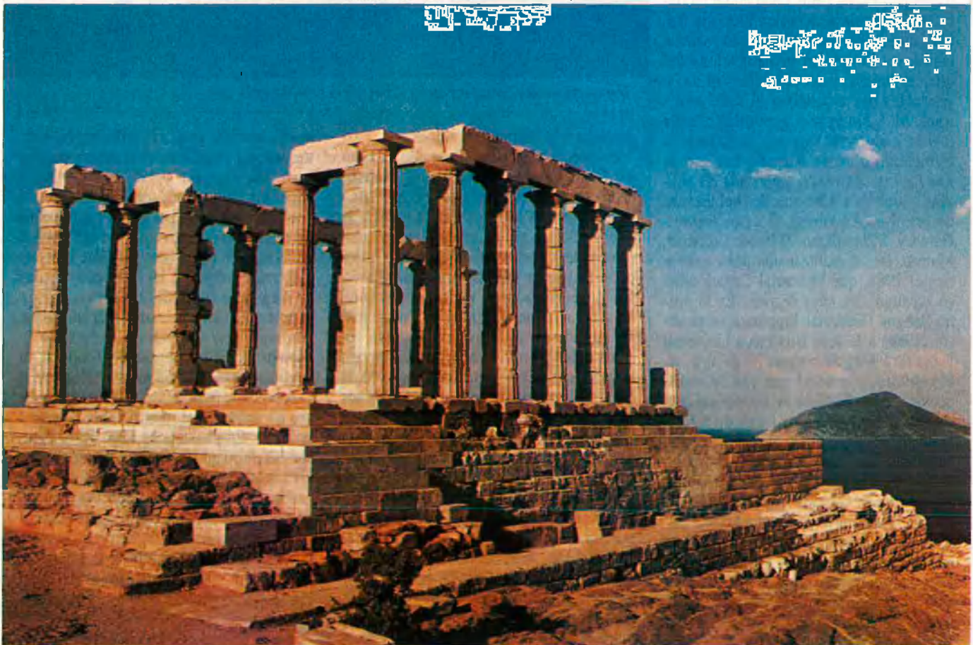
El llegat de Grècia encara està en gran part per redescobrir.

Igualment, contra la idea més o menys generalitzada que la llengua grega ha estat l'idioma d'ús comú des de l'antiguitat, cal