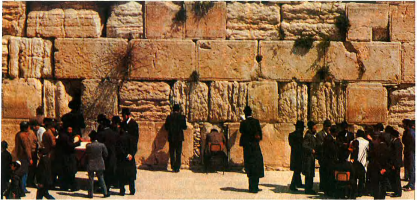
Religions i finances es mesclen pels indrets de la ciutat de Jerusalem.

Un dels èxits recents fou un edifici de 17 habitacions adquirit a un propietari cristià. Ateret els va fer les maletes i els comprà els bitllets per a Nova York. Una altra compra afortunada fou la galeria superior del Colton Souk, un edifici mame-luc renovat entre 1967 i 1977 pel comitè