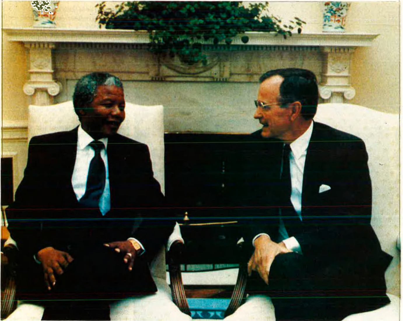
Nelson Mandela i Bush en la Casa Blanca.

—Les condicions a Europa són completament diferents de les que hi ha a l'Àfrica. Però Àfrica aprendrà de l'experiència europea. Una de les flaqueses va consistir que a Europa no hi havia cap possibilitat de participar lliurement i democràticament de la vida pública. A l'Àfrica desenvoluparem el nostre propi camí cap al socialisme.