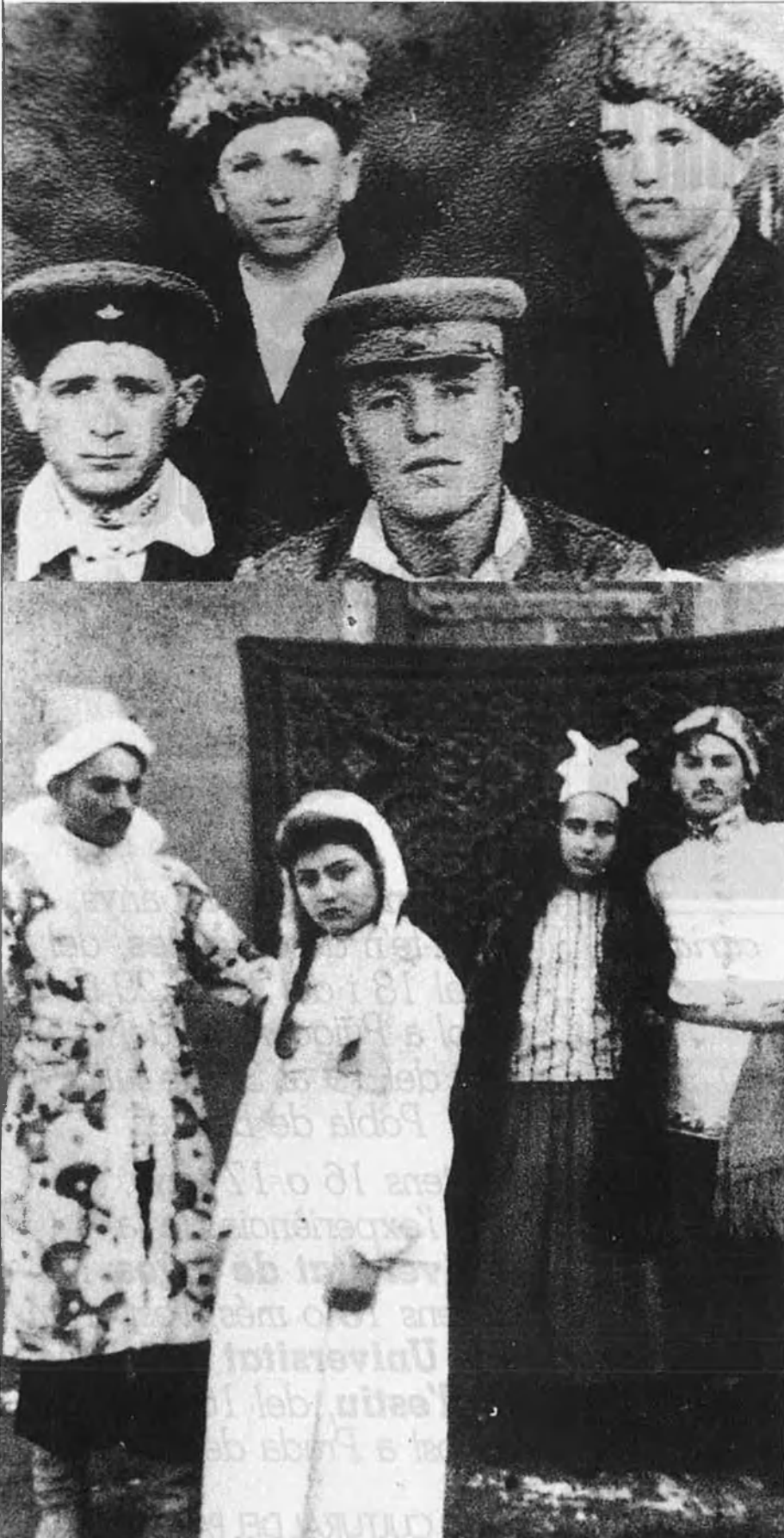
Va ser molt amic d'altres tres estudiants i el quartet era nomenat "Eis tres mosqueters". Baix, actuant com a comerciant en una obra de teatre (a l'esquerra).