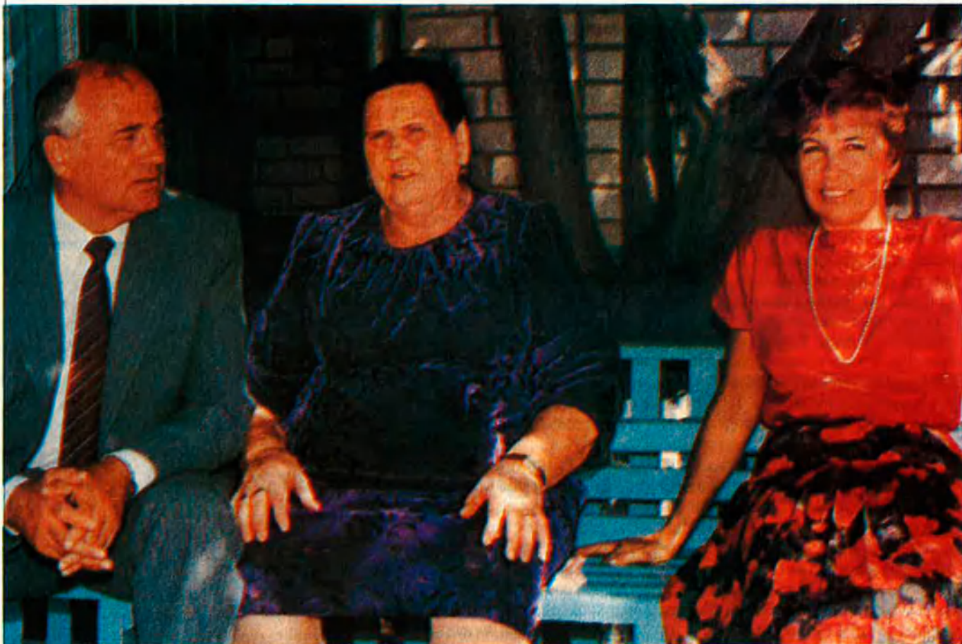
Amb les dues dones que han tingut una influència decisiva en la seua vida, su mare i Raisa.

de la infància de Gorbaxov es troba en la zona ucraïnesa, molt lluny de Prívolnoie. Allí, només hi havia unes quantes cabanes, diu un veí. Des de la finestra Mixa debia veure les poques vaques familiars xuclant terrossos a la vora del riu. Fins que Mixa no va anar a l'institut, en un poble més gran, no tingué una perspectiva de la gran tensió de planures amb herba que hi havia entre la suau línia de muntanyes que es fonien en la llunyania en un contorn morat borrós.