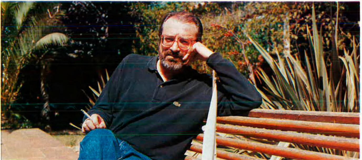
"Sóc tímid, per això sóc molt agressiu. Inclús personalment".