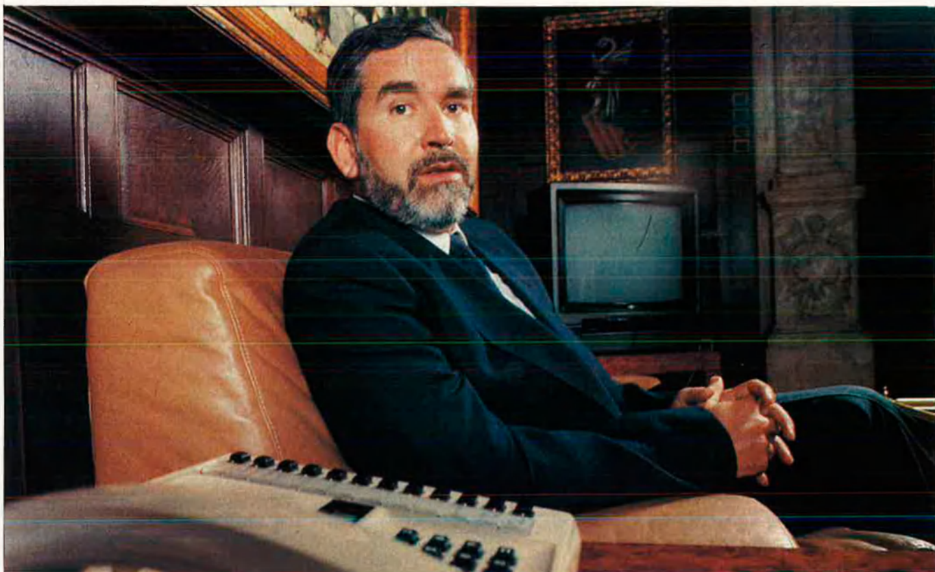
"Jo no he de rehabilitar Rafael Blasco perquè tampoc no l'he inhabilitat".