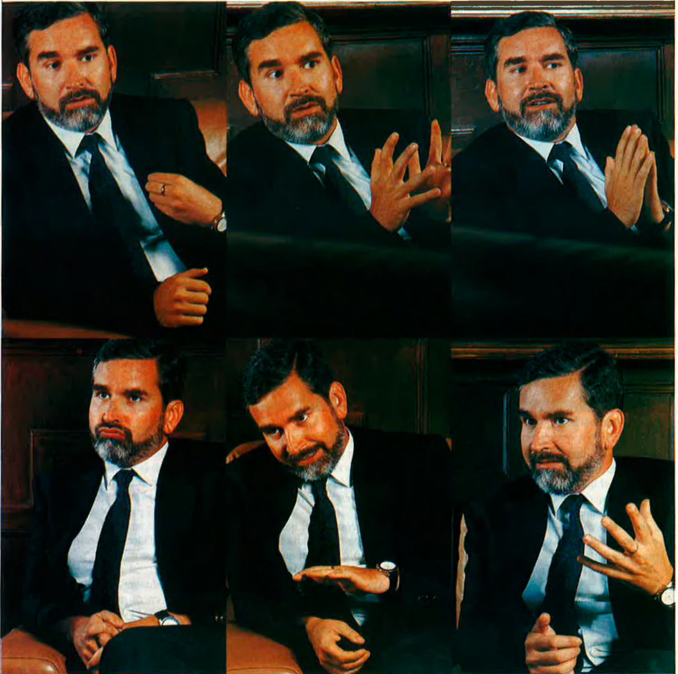
"Jo no estic en contra de la presència de TV3, però ha d'existir una reciprocitat real i no formal. I no veig possible que TVV arribi a Barcelona".