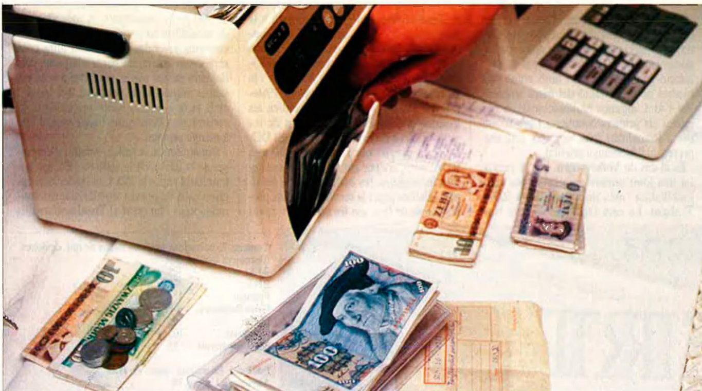
La reunificació dels dos estats alemanys comportarà fortes despeses i un considerable atur a l'antiga RDA.