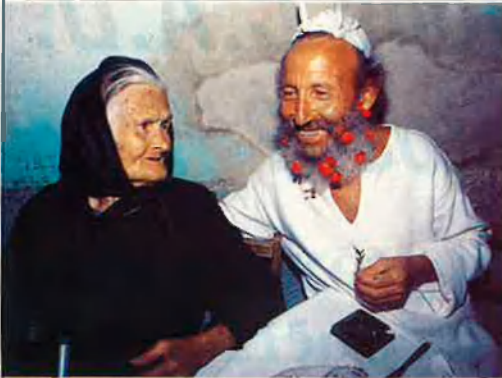
El Ripollés, amb una dona del Mas de les Flors.