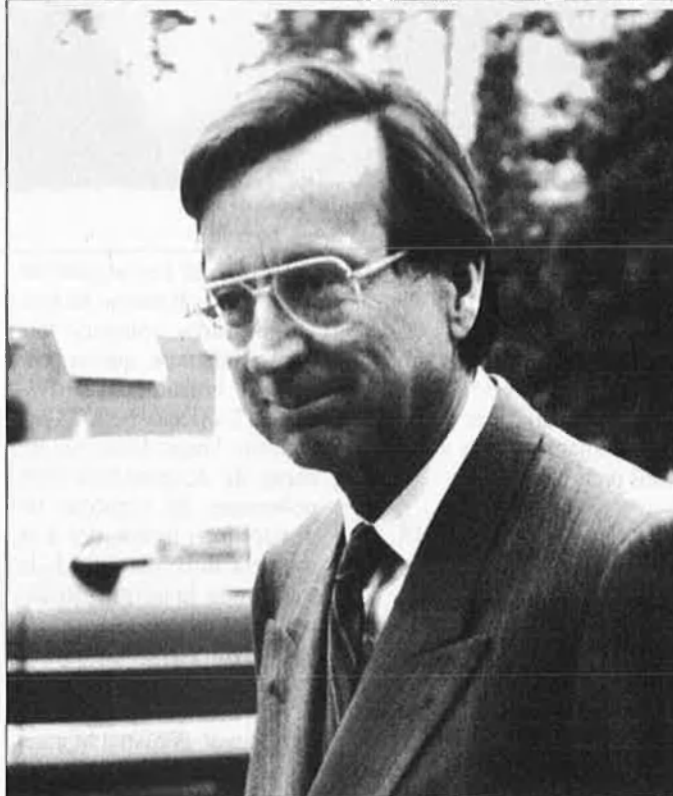
Robert Bourassa, primer ministre de Quebec.

bles. Primer la votació de Newfoundland i després la situació dins de Quebec.