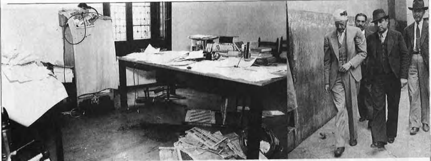
El despatx de Trotski després de l'atemptat. Coyoacán, 20, 8, 1940. (Foto E.D. / AGNM). R.Mercader conduït per la policia mexicana. (Herm.Mayo/ AGNM).