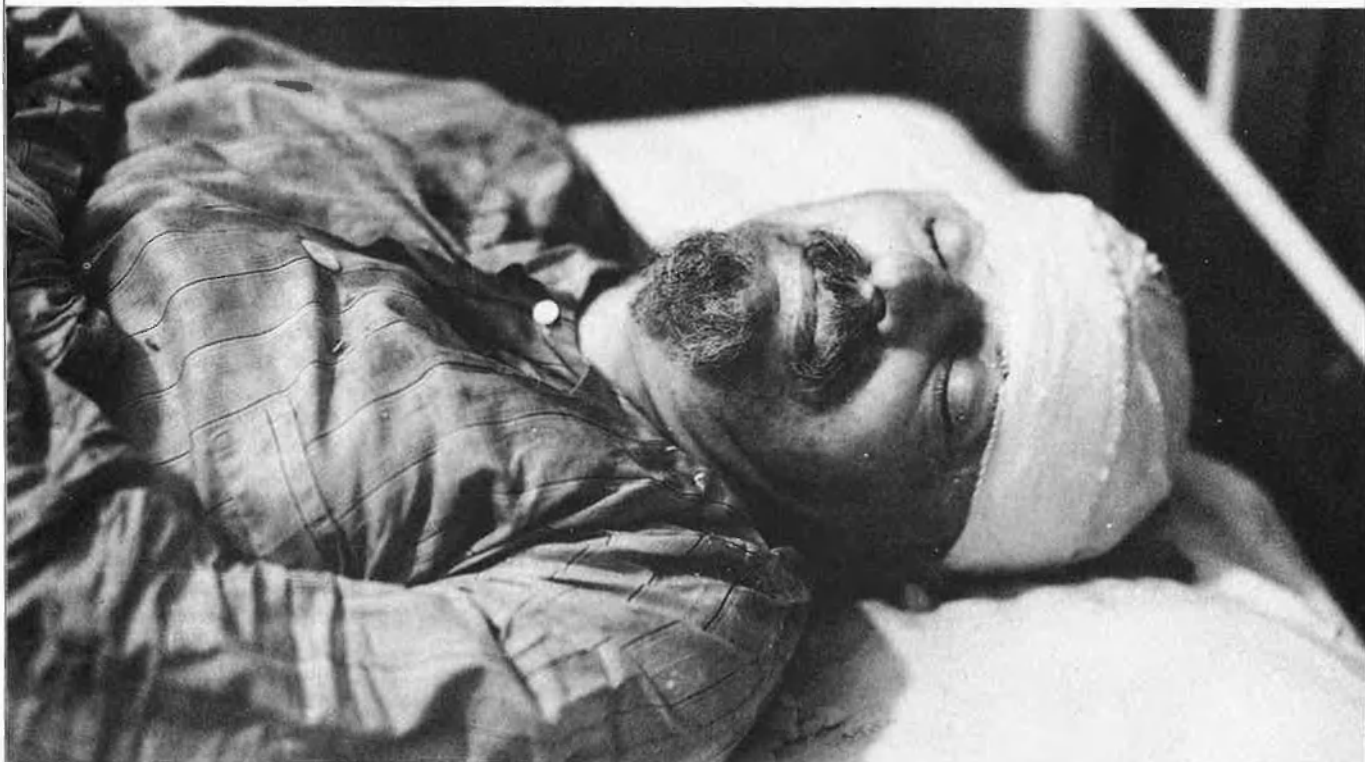
Lev Trotski mor a la seu de la Creu Verda de Mèxic, 21/8/1940.