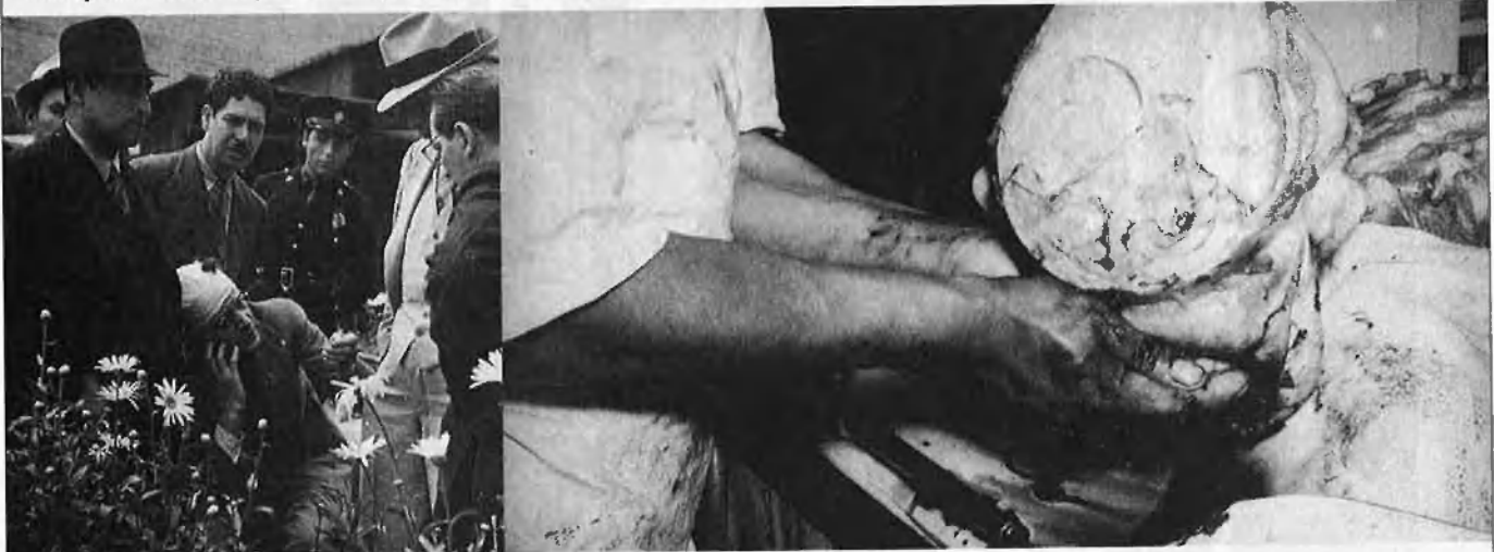
R. Mercader declarant a la policia al jardí de la casa de Trotski. 1940. El cap de Trotski després de l'autòpsia. 1940.