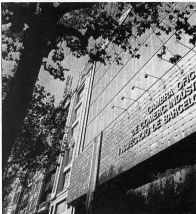
La integració comunitària vigent possibilita els intercanvis Catalunya i el Llenguadoc-Rosselló.

En aquest context de zona de gran vitalitat econòmica (200 milions anuals de dòlars en exportacions), i també en el context de l'euroregió tan defensada des de Perpinyà i des de Tolosa com a via ineludible del futur econòmic-social d'aquesta àrea de la mediterrània occidental, les Cambres de Comerç i d'Indústria del Llenguadoc-Rosselló i les Institucions de Badalona van signar el passat 5 de juny un conveni de cooperació, per tal d'aprofundir els intercanvis de persones, mercaderies, tecnologies i serveis.