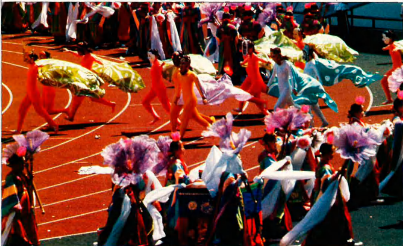
Inauguració dels Jocs Olímpics a Seül.

ca encengui i il·lumini tota la ciutat aquell 25 de juliol a la tarda, perquè l'espectacle no es limiti a l'Estadi de Montjuïc.