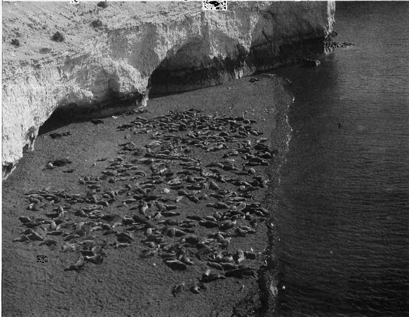
Punta Loma és una de les loberías permanents on es troben durant tot l'any agrupacions de lleons marins o llops marins, que és com allí els anomenen.

La contaminació produïda per la massiva industrialització i l'agitació de les grans ciutats fan que l'home contemporani busqui, cada vegada més, el contacte amb la natura i la soledat i magnificència de paratges llunyans. Soledat i magnificència que