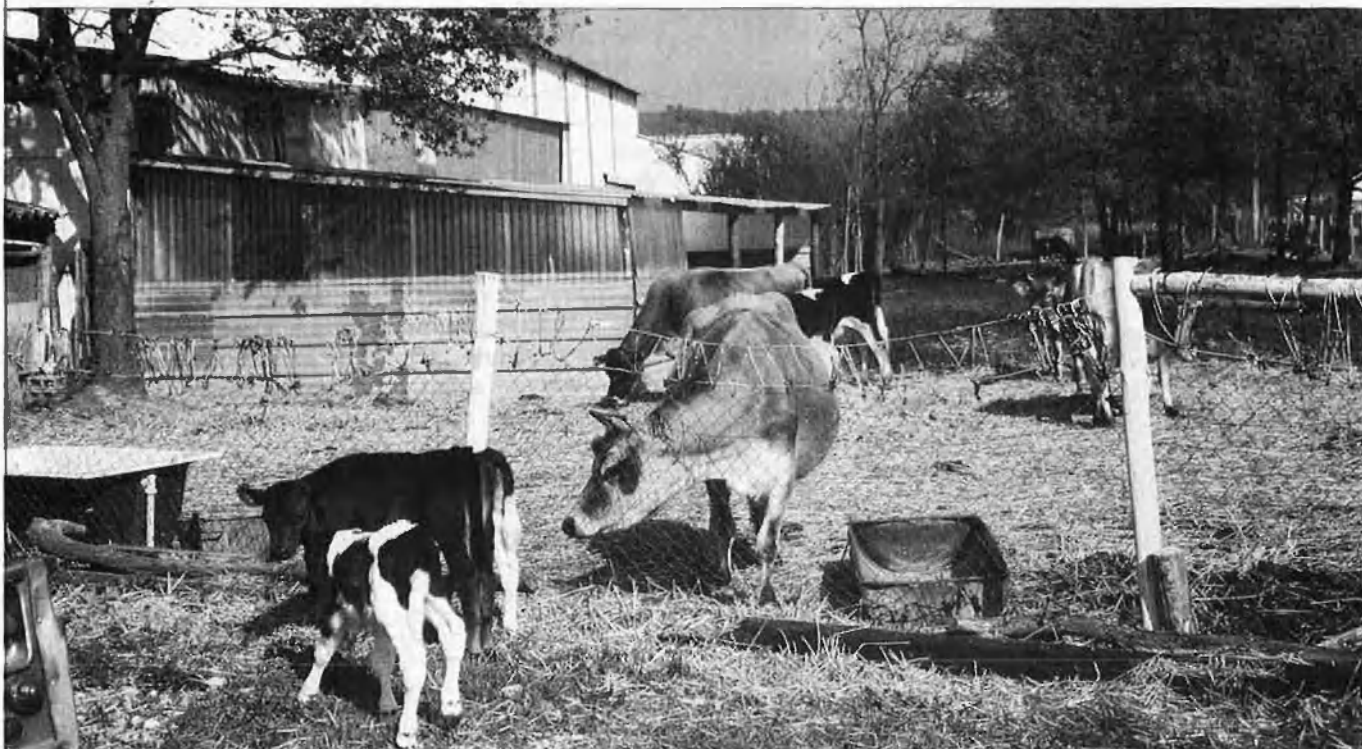
Vaques petites comparades amb la de grandària normal.

Potser la solució a la fam seria obtenir més ramats d'aquestes vaquetes, que necessiten molt menys espai en els prats.