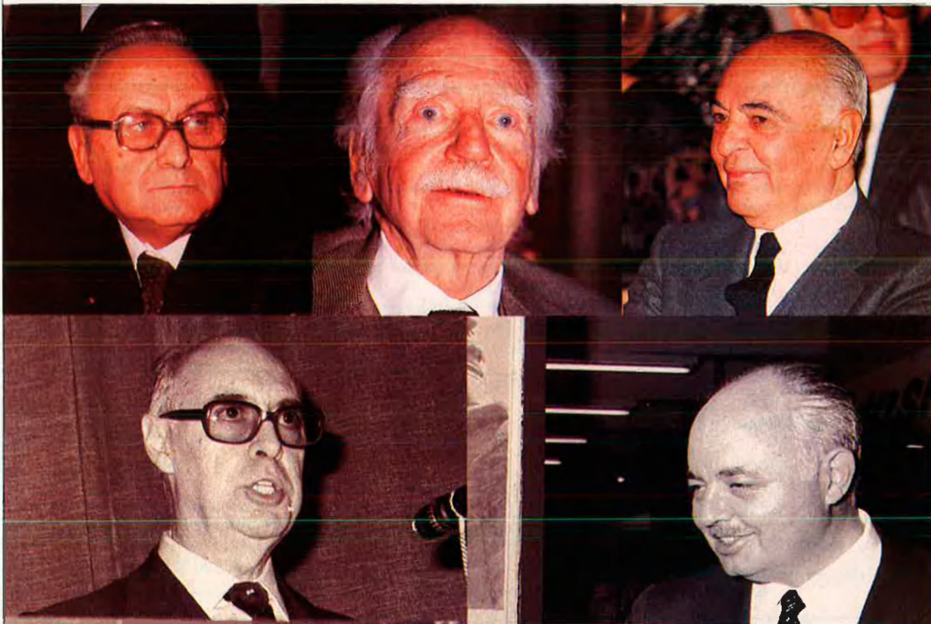
Álvarez de Miranda, Serrano Súñer, Solís, López Rodó i Vicente Mortes.

lio Botín i Luis Coronel de Palma , Marqués de Tejada, president de Finanzauto i de l'asseguradora Astra, vice-president de Fenosa i del Banco Central-Silva n'és vocal. Durant el seu mandat es va produir el transvasament Tajo-Segura i es va aprovar un primer programa d'autopistes.