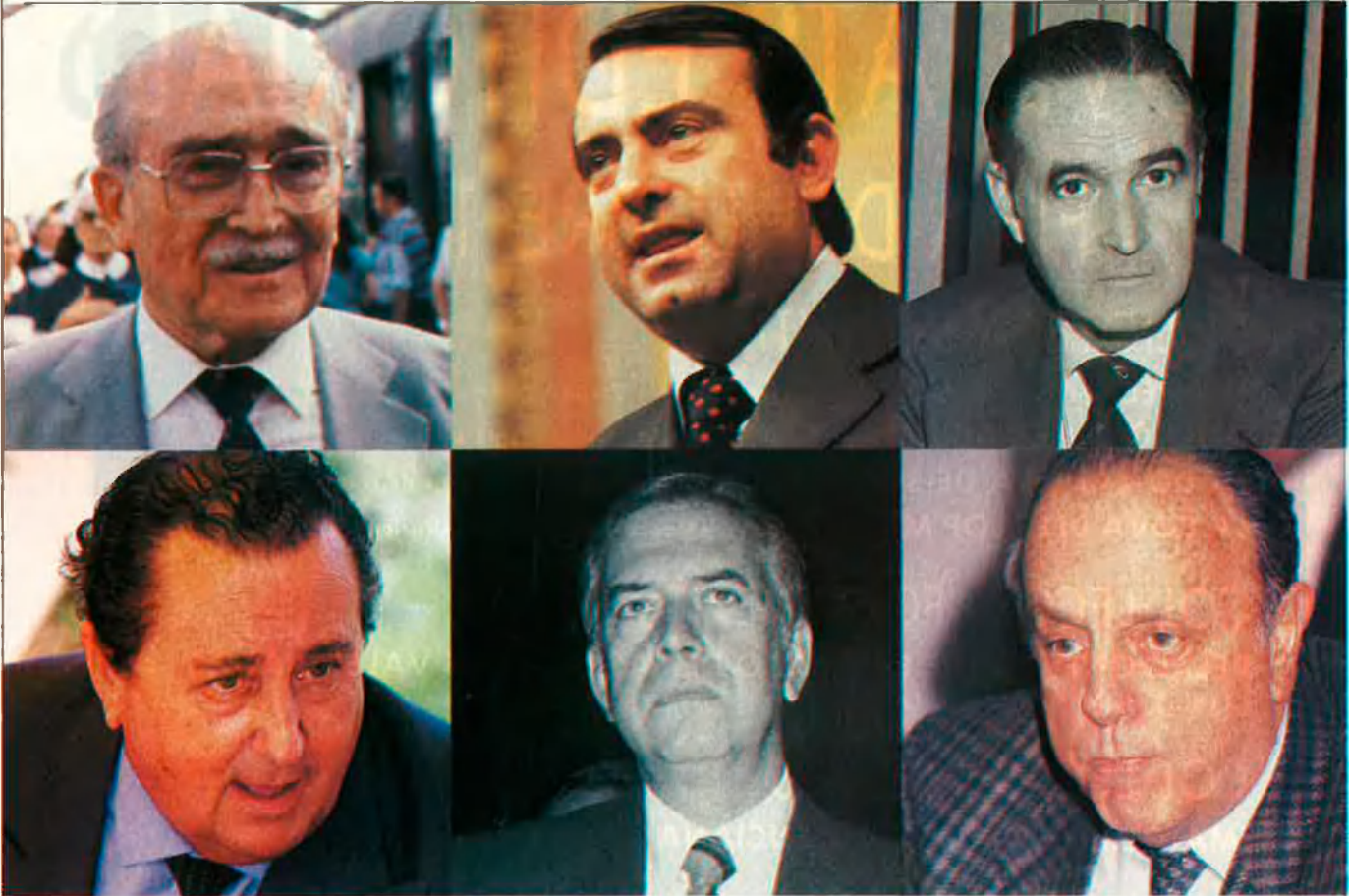
Antonio Oriol, Martínez Esteruelas, López de Letona, Pío cabanillas, Monreal Luque i Fraga.