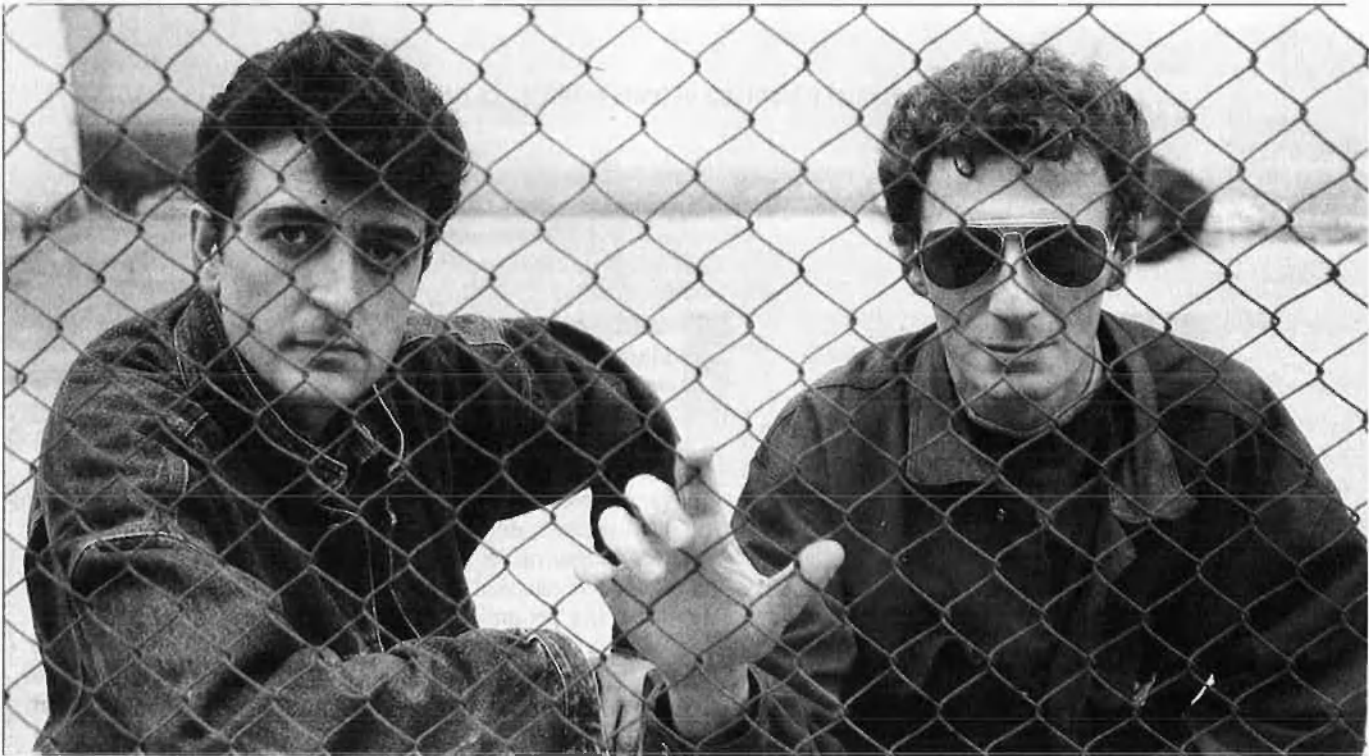
El Último de la Fila ha reunit al seu voltant un grapat de músics catalans que comencen.