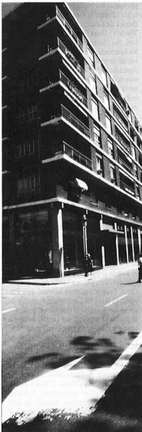
Alfons el Magnànim, 5, el despatx d'un nou poder.