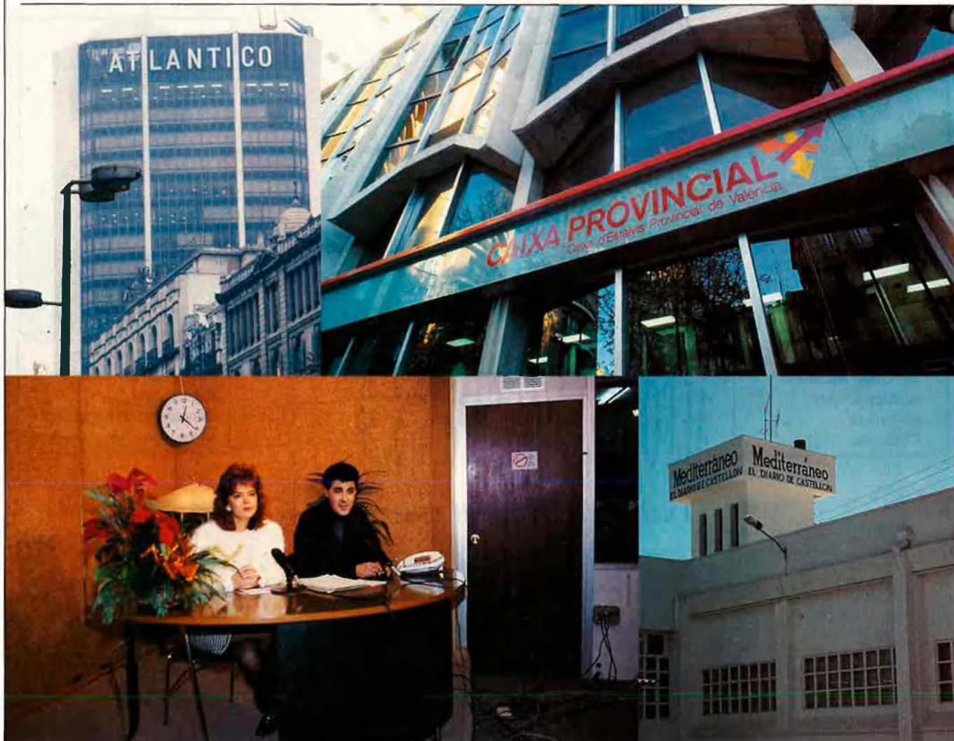
Al Banco Atlántico li volen comprar el Banco de la Exportación. La Caixa de València ja participa en la CFM. Pessa vol venir a València i entrar en Tele-Elx. El diari Mediterráneo es troba fortament participat per la CFM.