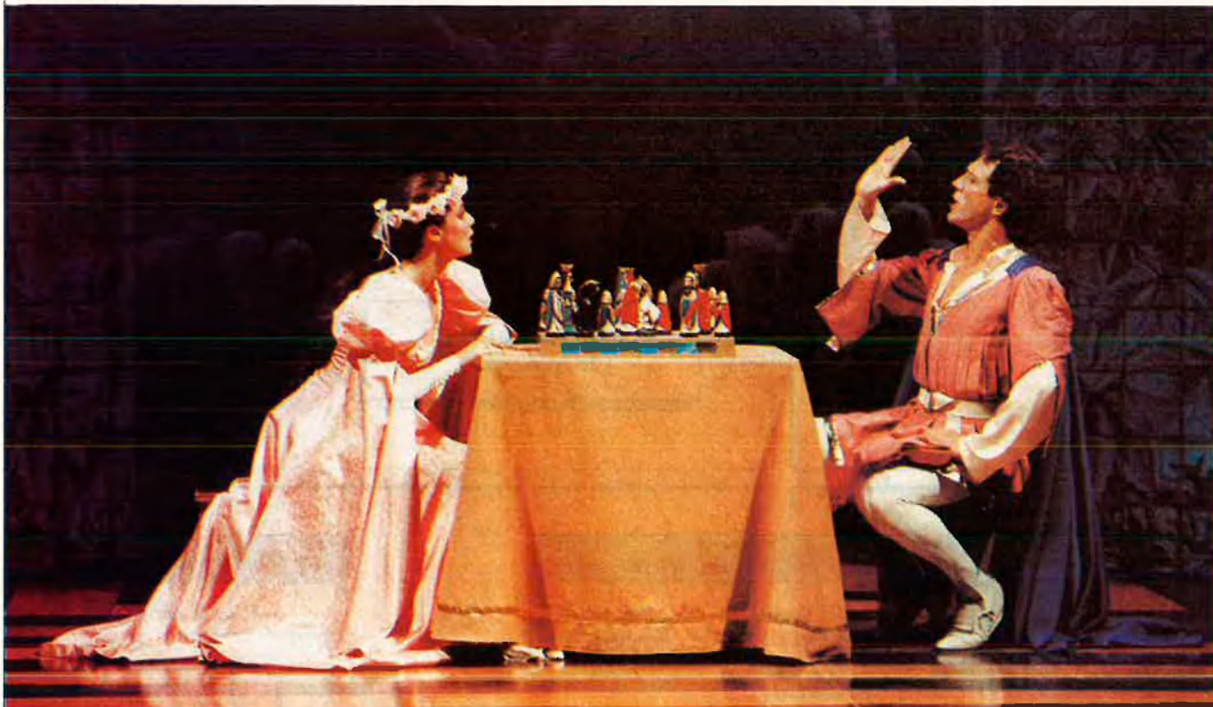
L'any 1986 es va crear el Teatro Nacional Clásico amb la missió de recuperar els textos de totes les èpoques.