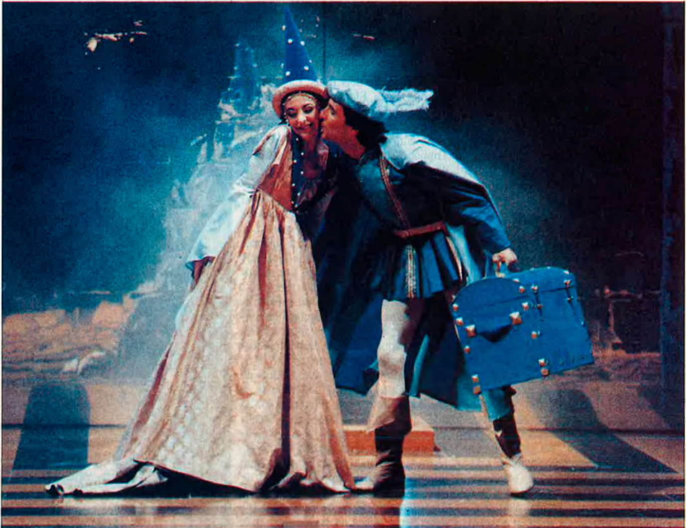
Escena d'"El vergonzoso en Palacio" de la Compañía Nacional de Teatro Clásico.

legalment el nom de Teatre Nacional , i Adolfo Marsillach, actual director general de l'Instituto Nacional de las Artes Escénicas y de la Música, aprofita la seva estada a Barcelona per admetre públicament que voldria trobar una seu per presentar-hi el teatre en castellà que ara per ara omple taquilles i es queda curt de representacions a Barcelona. Marsillach afirma sense embuts: "Hi estic al