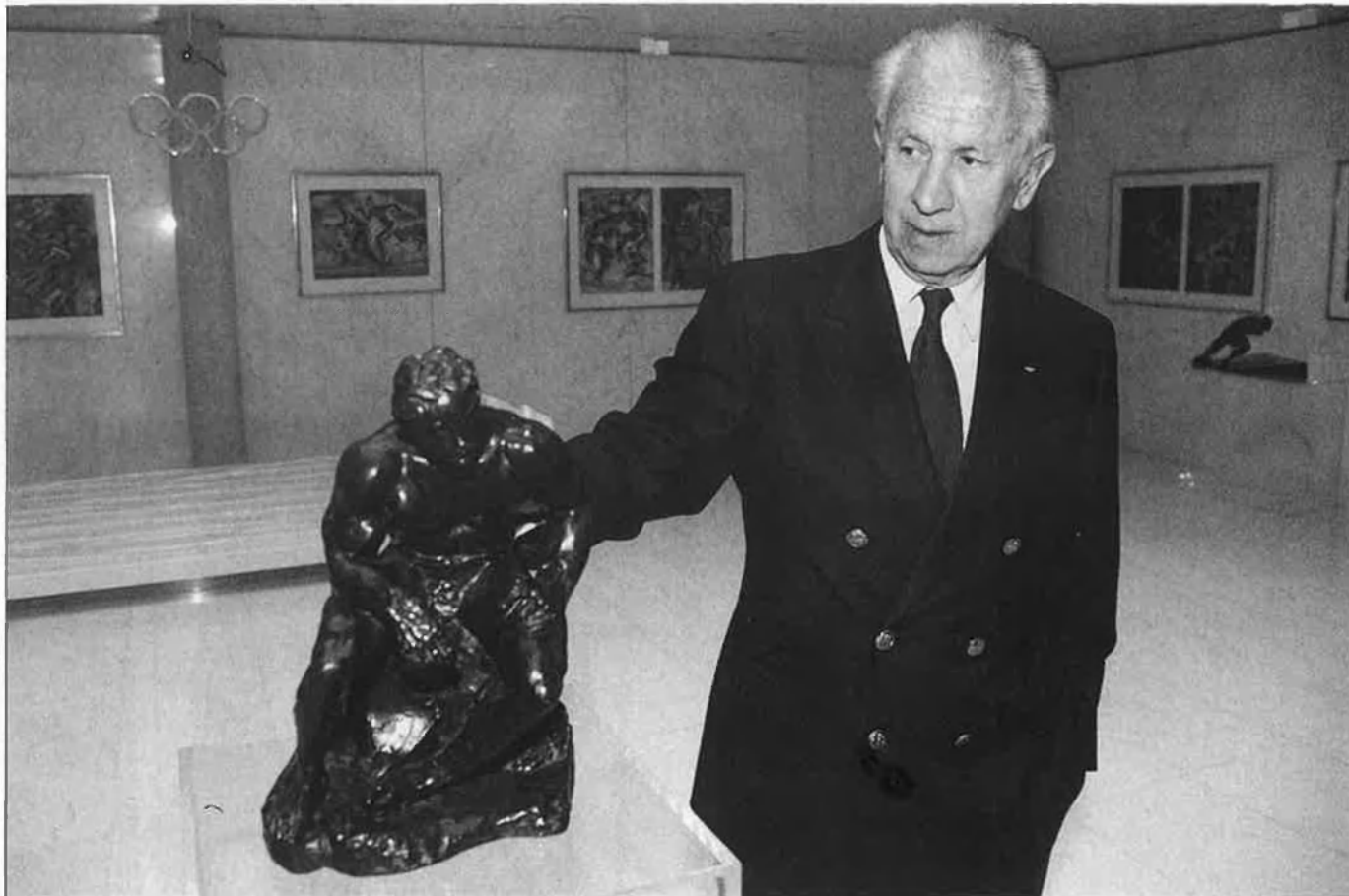
"Tinc molts amics comunistes, perquè són amics de la Família Olímpica, on les idees polítiques tenen una importància relativa".