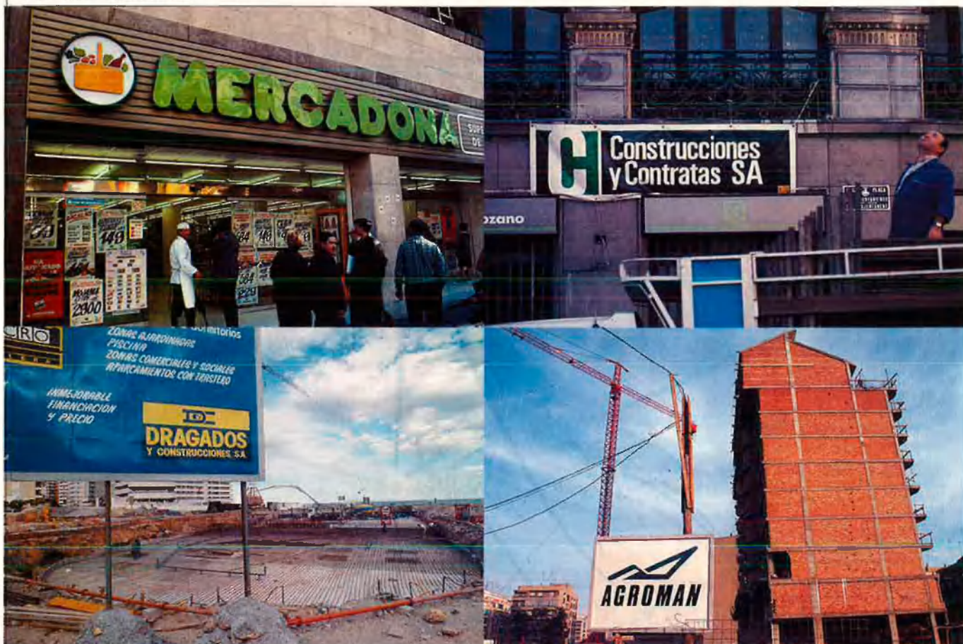
La construcció, una font més per a finançar partits.

pendre partit sobre l'assumpte de les contractes de la neteja d'Alcantar i Elx.