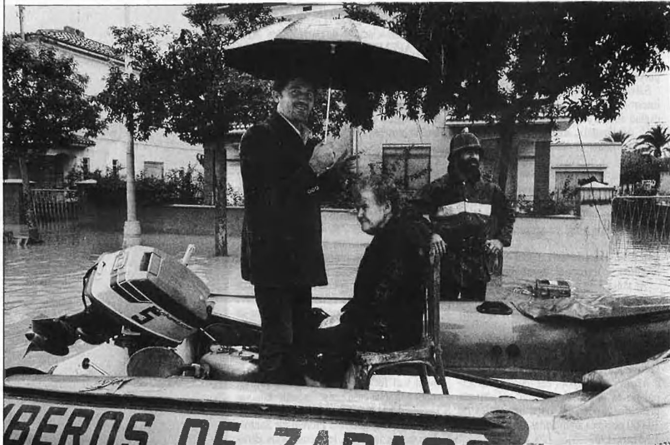
22.000 damnificats a la comarca de la Ribera.