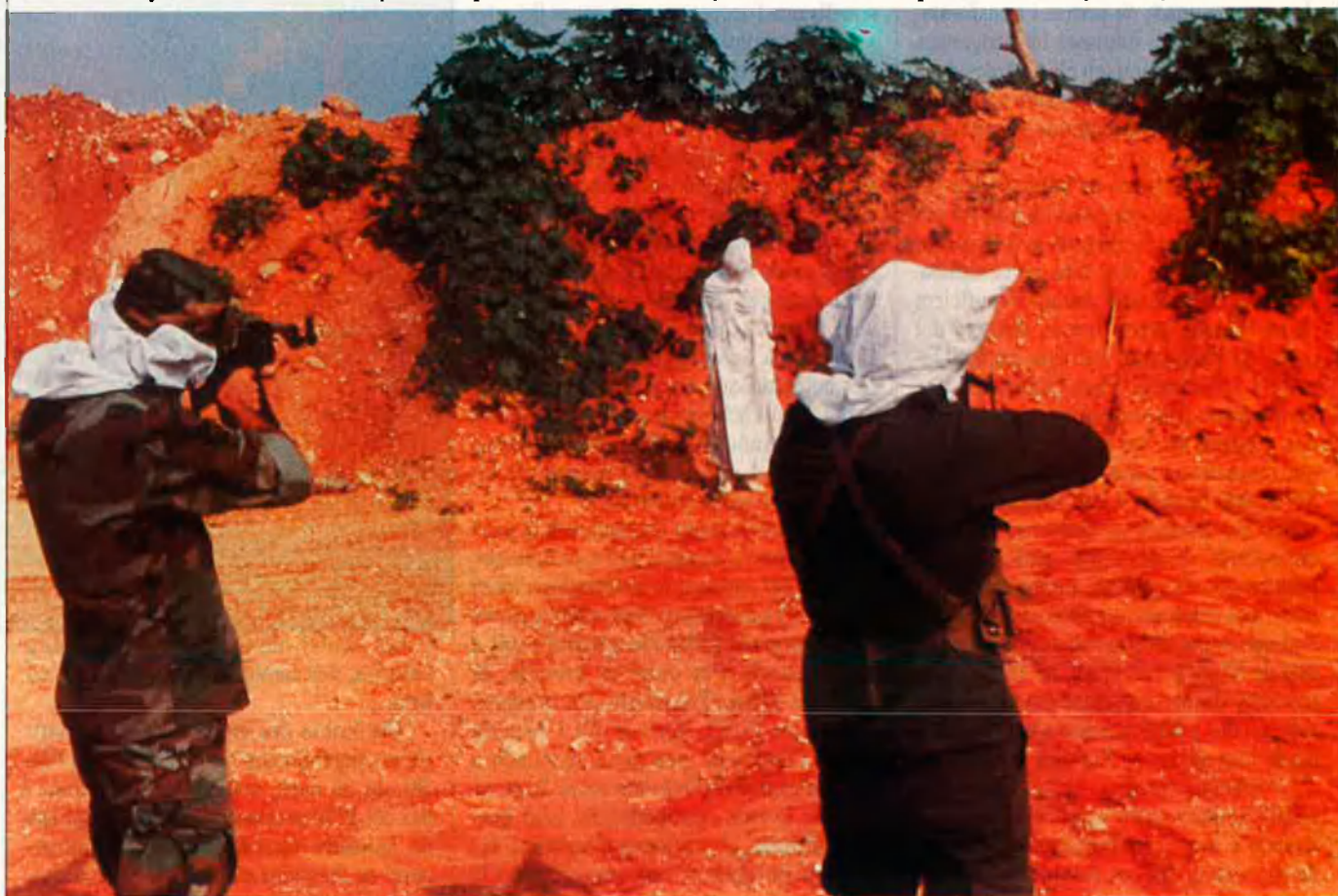
L'afusellament s'utilitza molt sovint per acabar amb els dissidents.

Els dos volums d'Amnistia acaben de ser publicats a Itàlia per Hoepli. El crit de les