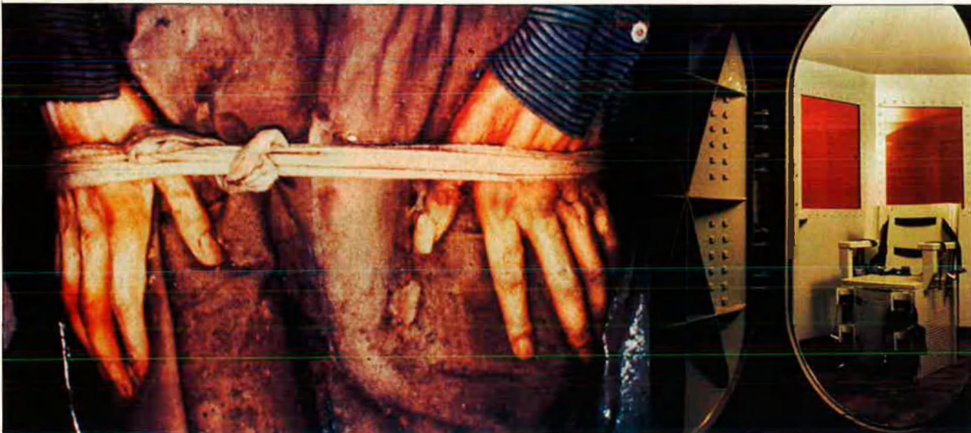
L'oposició també és castigada amb tortura i cambra de gas.

Tibet la policia de Deng aixafa les manifestacions antixineses amb ferocitat científica. Els detinguts són colpejats amb bastons elèctrics, penjats del sostre pels braços, obligats a estar nus amb els peus en punta durant llargs períodes. Un altre microepisodi entre molts, a les Filipines: presoners ofegats amb sacs de plàstic o a l'aigua, obligats a jaure damunt de gel, torturats amb la introducció d'objectes metàl·lics a l'anus.